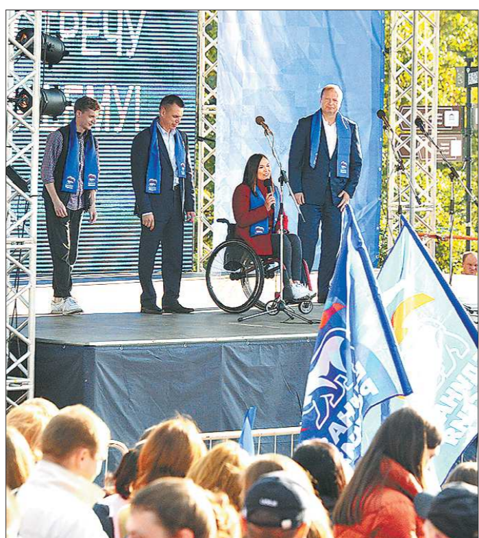
По традиции единосельские поблагодарили тех, кто пришёл на избирательные участки, на митинге в центре Екатеринбурга