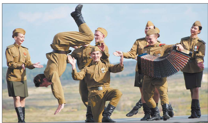
На полигон «Старатель» вернулись пока только развлечения