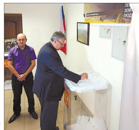
Первый глава Екатеринбурга Аркадий Чернецкий выбирает будущее города