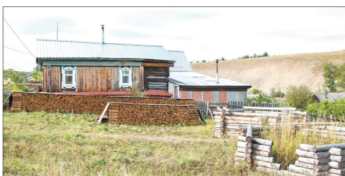
Через четыре месяца все строительные работы на дачных и садовых участках придётся согласовывать с местной администрацией

Пока департамент государственного жилищного и строительного надзора Свердловской области не даёт детальных комментариев, но сообщает, что собственнику нужно будет уведомить в муниципалитет уведомление о планируемом строительстве, указав в нём сведения о застройщике, земельном участке и параметрах планируемого объекта. Документ можно будет принести лично, отправить заказным письмом либо через портал госуслуг или МФЦ.