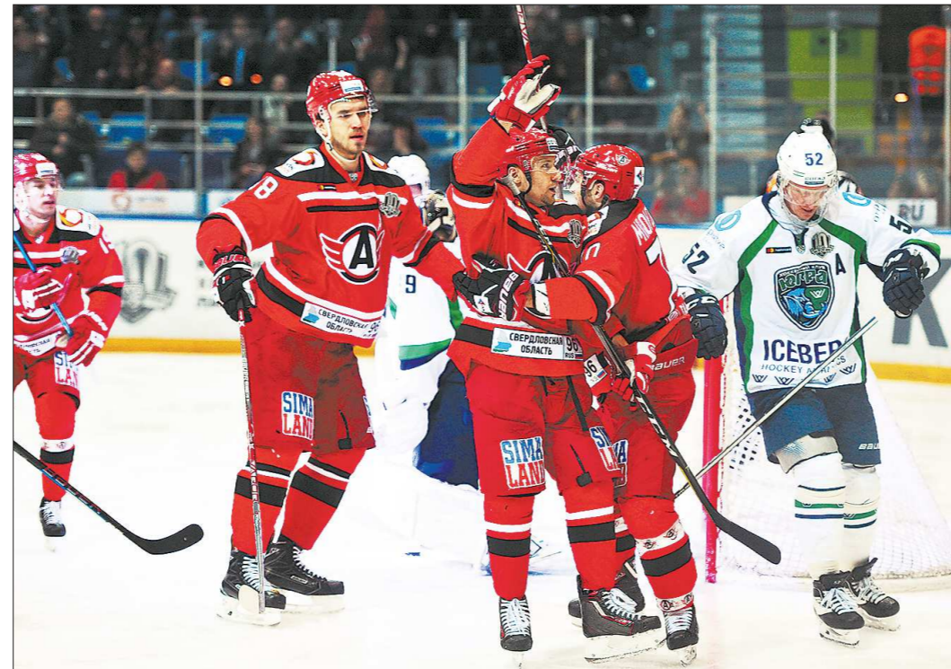
16 октября 2017 года. Игроки «Автомобилиста» празднуют гол в ворота ханты-мансийской «Югры». Надеемся, что в предстоящем сезоне подсветка ворот соперника будет включаться часто

ВОЗВРАЩЕНИЕ МАРТЕМЬЯНОВА. Новым тренером «Автомобилиста» Андрея Мартемьянова можно назвать с большой натяжкой. В сезоне 2011/2012 он, хоть и в статусе исполняющего обя-