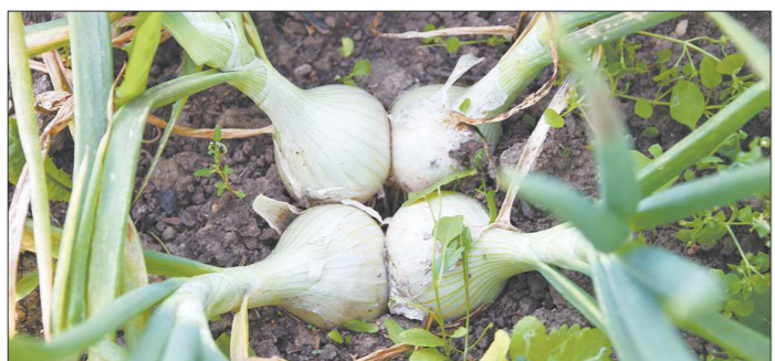
Крайне важно вовремя убрать лук с грядки, иначе луковички будут плохо храниться