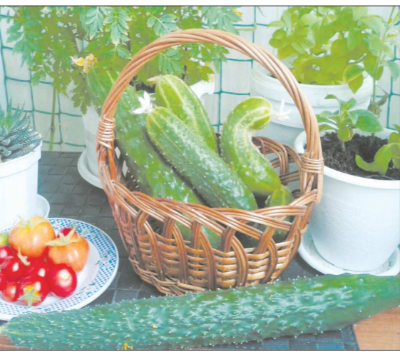
Китайский огурец длиной в 35 сантиметров — самый крупный плод на огороде Любови в этом году

На балконе хозяйка отдыхает: здесь у неё и столик с не-