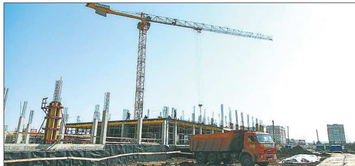
Школа в микрорайоне Муринские пруды в Нижнем Тагиле растёт не по дням, а по часам