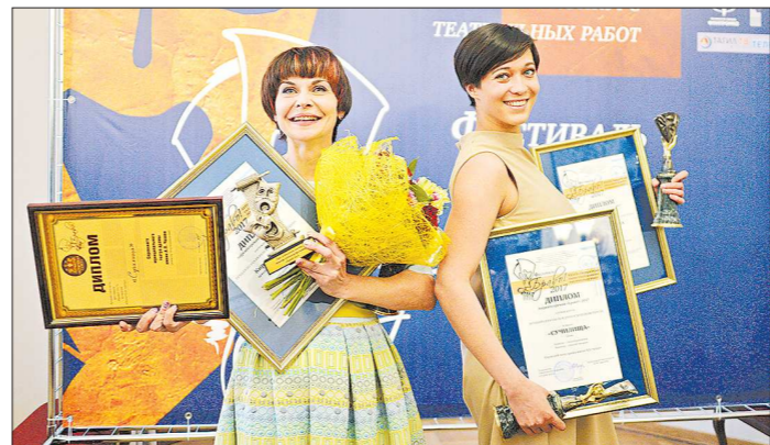
Вот так триумфально Серовский театр завершал прошлый сезон