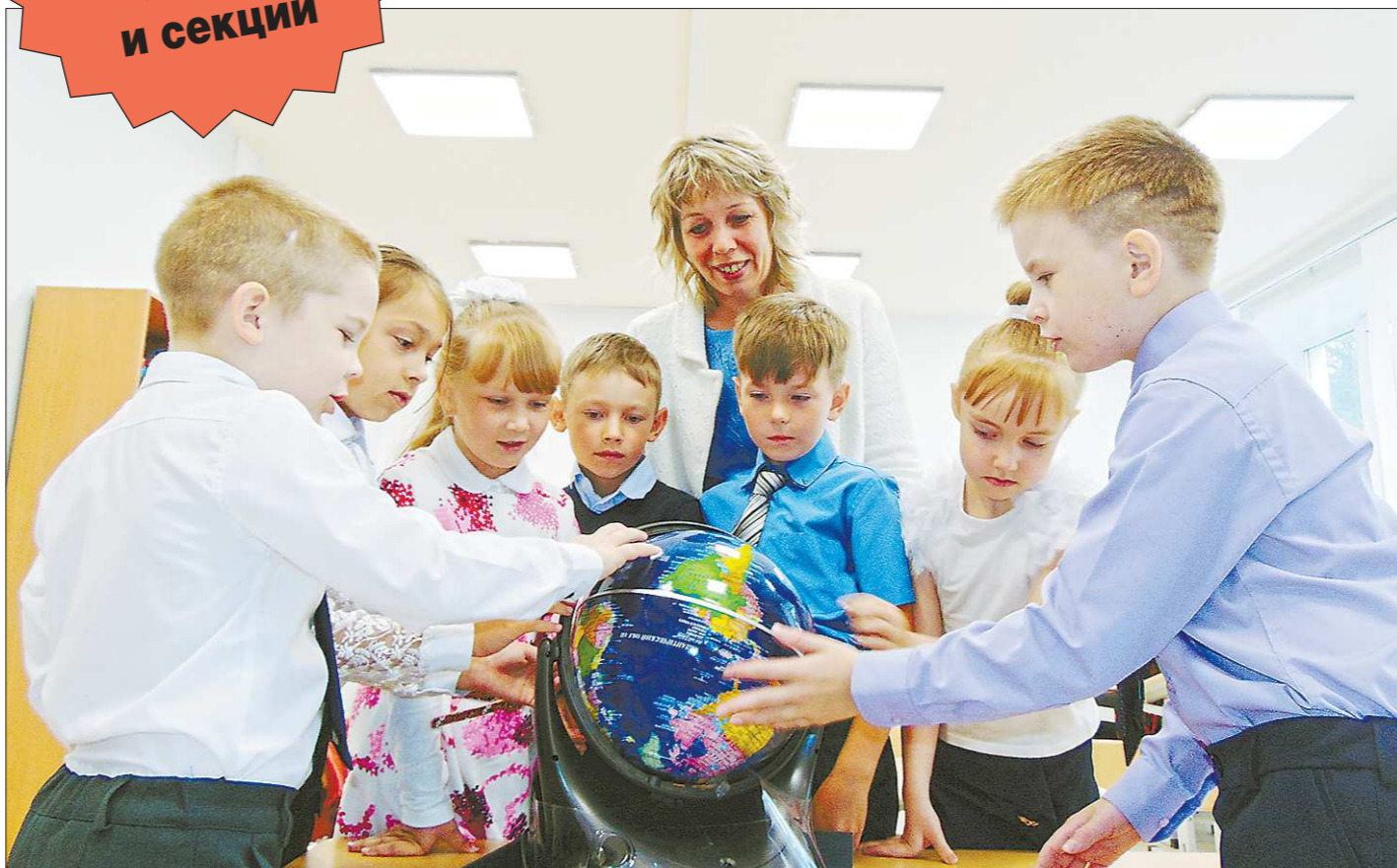
В посёлке Горноуральском капитально отремонтировали и оборудовали техническими новинками здание начальной школы. Первokлассники нашли на интерактивном глобусе Россию, потом Уральские горы. Расстроились, когда выяснили, что на нём нет их посёлка...

Сегодня в школы Свердловской области пойдут 58 тысяч первоклассников