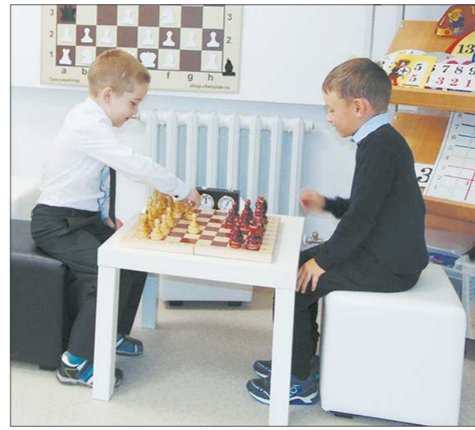
Учебный год только начался, а школьники уже ходят конём и ферзём