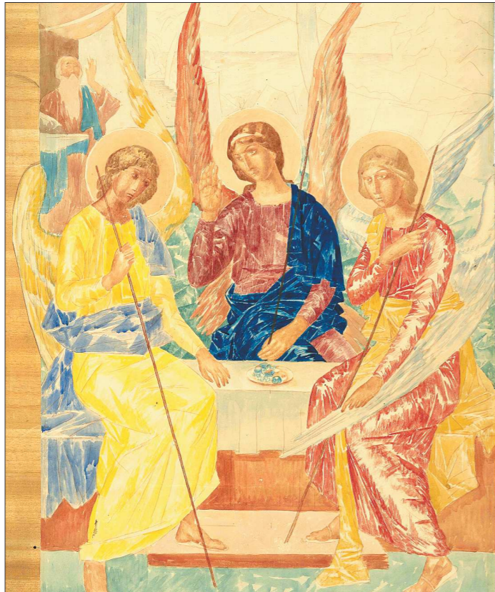
В числе 38 произведений живописи и графики, переданных в дар из коллекции Казимиры Басевич Екатеринбургскому музею ИЗО, есть настоящая жемчужина — акварель Кузьмы Петрова-Водкина «Троица»

В столице Урала в полностью преображённом выставочном зале Екатеринбургского музея изобразительных искусств открылась масштабная выставка «Владелица Красного коня. Дар Казимиры Басевич музею России».