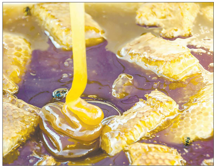
Качественный мёд должен быть густым и медленно стекать вниз

Магазины, как правило, закупают низкосортные, дешёвые виды мёда и делают наценку. Такой товар менее качественен и полезен, — комментирует пчеловод, руководитель Областной кон-