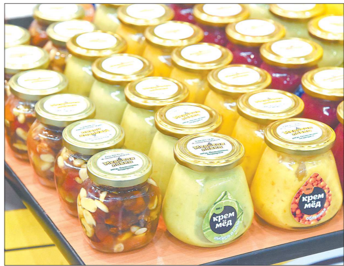
Крем-мёд несколько не лучше обычного: только дороже

Если кристаллизуется, это абсолютно нормально и никак его качества не вредит. Консистенция мёда должна быть однородной и прозрачной, без осадков и расслоений, которые говорят