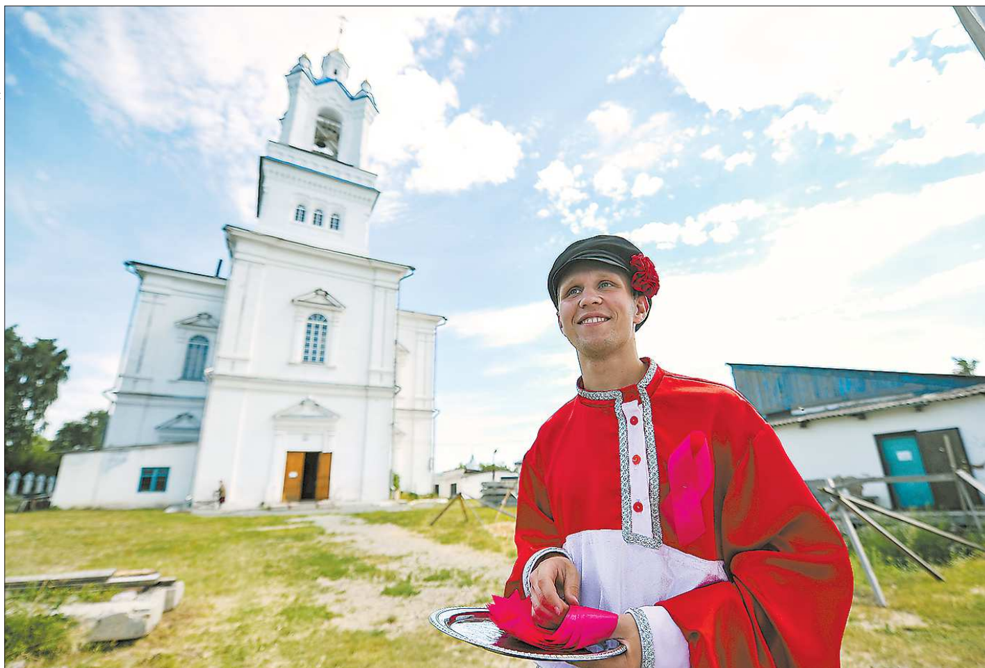
Накануне юбилея в Камышлове отметили обновление Покровского собора: звонница пополнилась тремя колоколами весом в 1 тонну, 1,2 тонны и 800 килограммов