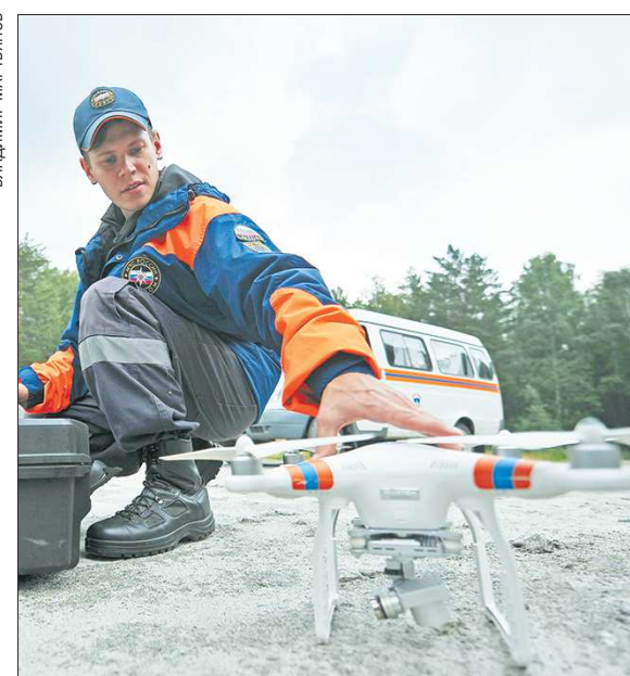
Сегодня беспилотники охватывают видеонаблюдением практически всю территорию Свердловской области

У одного садовода огнетушитель, как выяснилось, в са-