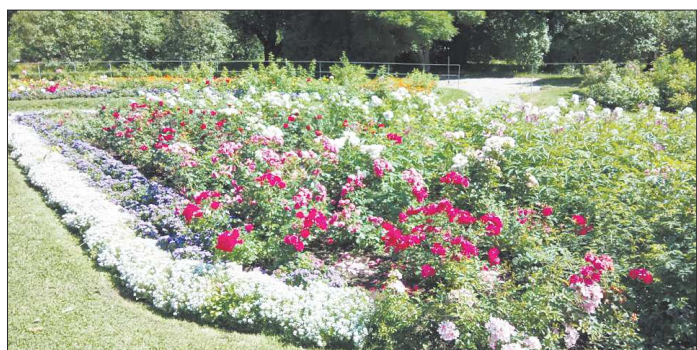
При хороших подкормках ваши цветы будут расти так же пышно, как и в ботанических садах