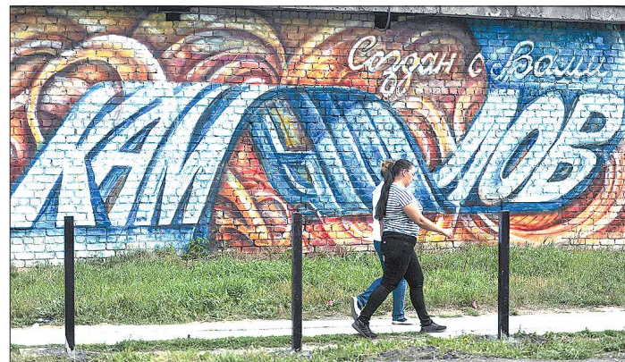
Это граффити сделал местный житель — мэрия поддержала инициативу молодого человека

Самый большой исторический памятник Камышлова — Торговая улица протяжённостью чуть больше километра. Несмотря на то, что теперь она официально носит имя Карла Маркса, в народе она остаётся «торговой» — больше двухсот лет первые этажи зданий