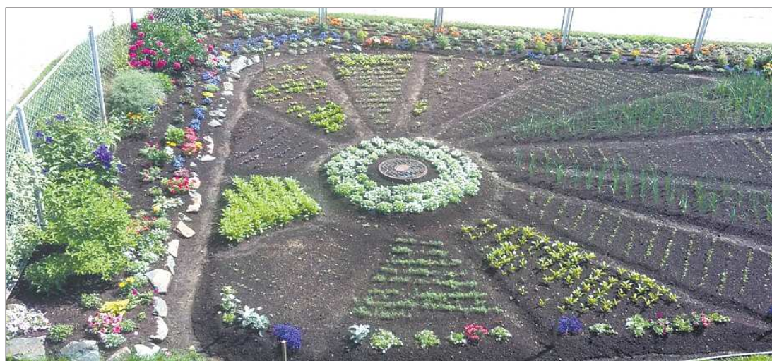
Участок Риммы не очень светлый, но французские грядки дают прекрасный урожай