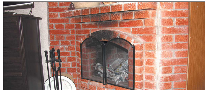
Печь или камин на даче необходимы, но важно своевременно проводить их обслуживание

Так, в первую очередь стоит прочистить дымоход и трубы печи от сажи, образовавшихся кирпичей и другого мусора. Это нужно для качественной тяги, которая будет не толь-