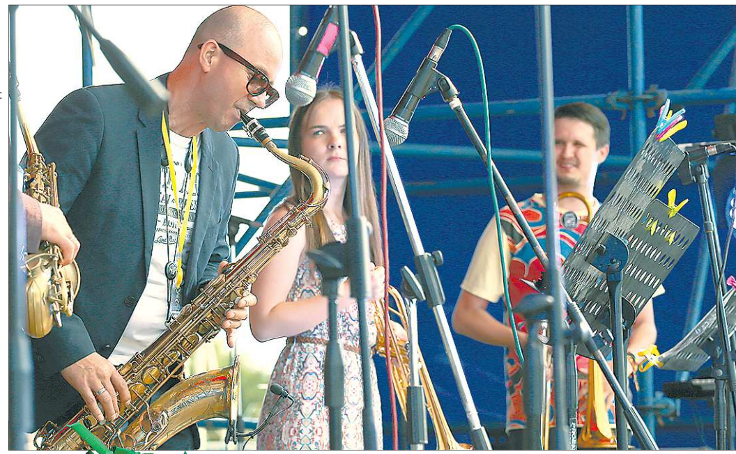
Камышловцам понравился символ земляники

Сейчас главной визитной карточкой Камышлова можно назвать... джаз. Именно UralTerraJazz положил начало фестивально-