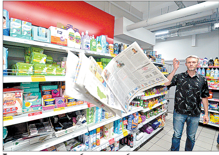
Торговая сеть решила буквально выбросить все газеты из магазинов