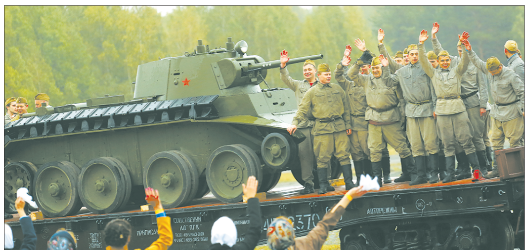
Тагилчане попрощались с международной выставкой вооружения, но каждый год всё ещё надеются на её возвращение