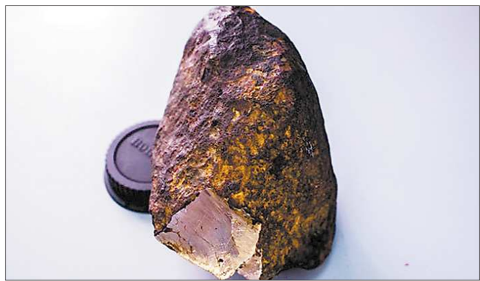
Метеорит «Уакит» учёные нашли в Бурятии, когда искали... золото