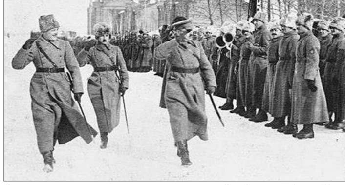
Построение чехословацких подразделений в Екатеринбурге. Из 50 тысяч «русских чехов» семь-восемь тысяч легионеров постоянно дислоцировались в столице Среднего Урала

– Вы докопались до малоизвестных, а порой и просто неизвестных доселе фактов пребывания чехов в Екатеринбурге. Многие из них реально здорово повлияли на развитие Урала. Не ошибаюсь? – Это история о том, как чужая земля может стать второй родиной. О том, какой необычайный слав культуру закаливается в горниле лихолетий. Чешские легионеры во время недолгого пребывания на Урале основали здесь трубное и ортопедическое производство. Активно соучаствовали и в культурной жизни. Достаточно сказать: легионерский оркестр дал более двухсот концертов по Сибири и Уралу, и чаще всего в таких городках, где до этого симфонических концертов не случалось. В зале ожидания Екатеринбургского вокзала легионерами была поставлена опера «Проданная невеста», причём заглавные партии исполнили будущие звёзды Пражской оперной сцены. С другой стороны, нельзя переоценить тот вклад, который внесли русские эмигран-