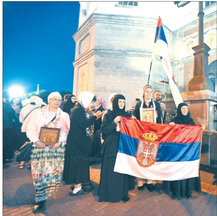
Группу паломников из Сербии, которые растянули национальные флаги у патриаршего подворья и пели песни о любви к России, с первого взгляда вполне можно принять за футбольных болельщиков (разве что мелодию у крестоносцев лиричнее). По их словам, православие исторически объединяет наши народы