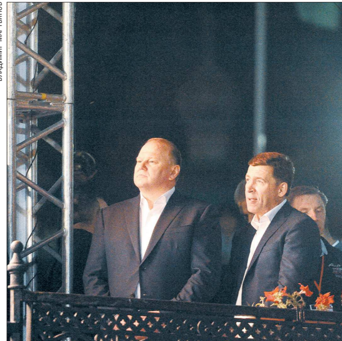
Полномочный представитель Президента РФ в УрФО Николай Цуканов и губернатор Свердловской области Евгений Куйвашев во время Божественной литургии перед ночным крестным ходом. До Ганиной Ямы они шли вместе