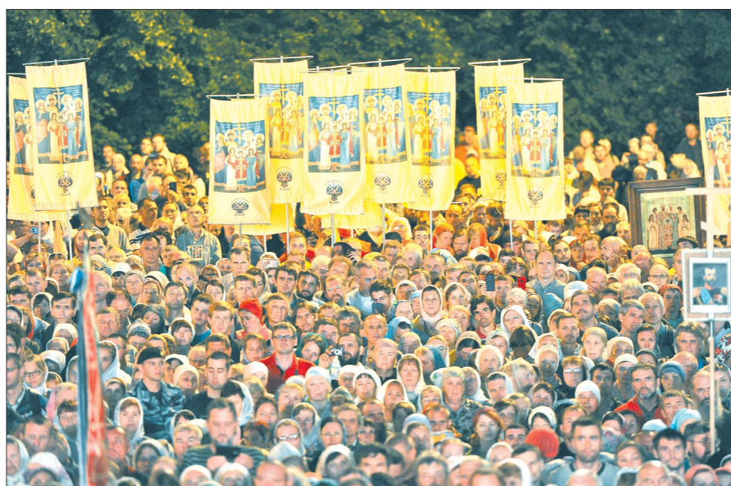
В этом году в Екатеринбург приехали паломники из США, Новой Зеландии, Сингапура, Сербии, Испании, Украины, Великобритании и других стран. Большинство из них прибыли, чтобы пройти крестным ходом, причаститься и покаяться за преступление царевичей