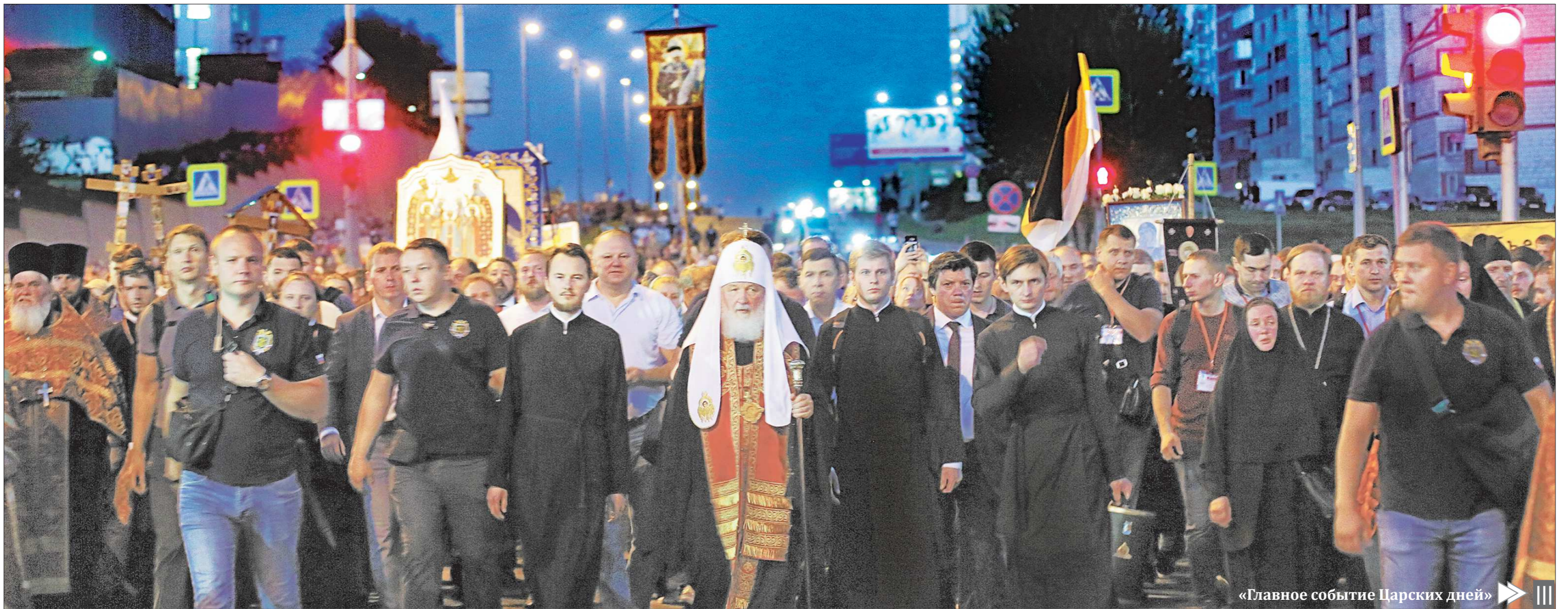
«Главное событие Царских дней»