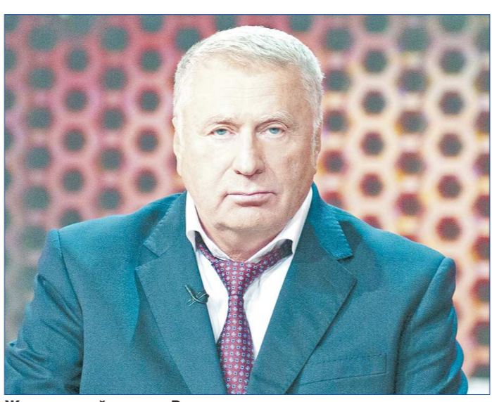
Жирновский уверен: Россия сможет жить лучше

Советский Союз заплатил неминуемую цену за победу во Второй мировой войне, которая для нашего народа стала Великой Отечественной. После 1945 года в Европе была распложена семимиллионная советская армия, которая контролировала весь континент. Британия и США отлично понимали, что им нечего противопоставить СССР, и были настроены на компромисс, а не на конфликт. В 1947 году США предложили всей Европе, и в том числе СССР, план Маршалла. Эта программа предусматривала оказание экономической помощи всем европейским странам, пострадавшим в годы войны. Но Сталин решил, что это инструмент антисоветской политики, и отказался. Кроме того, он запретил пользоваться американской помощью странам Центральной и Восточной Европы. Итог извращён — на американские деньги страны Западной Европы, включая ФРГ, быстро восстановили свою экономику, уровень жизни побеждённых оказался выше уровня