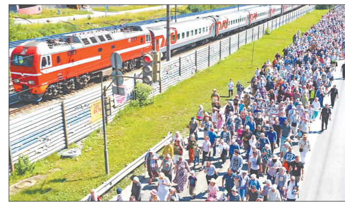
Малый крестный ход становится своего рода релаксацией большого ночного шествия. Кто-то пробует свои силы, кто-то решает пройти оба маршрута