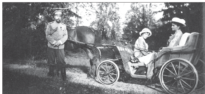
Николай II с супругой Александрой Фёдоровной и дочерью Ольгой в Могилёве. 1916 год