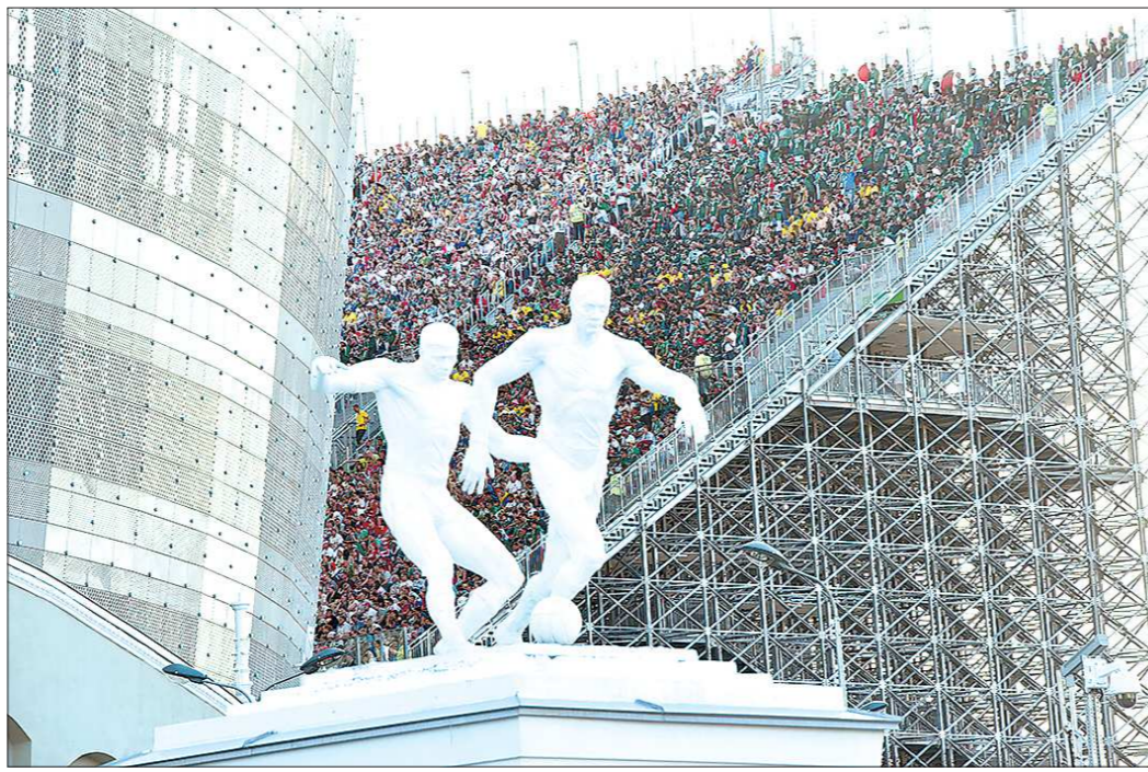
Полный стадион на матче Швеция – Мексика. И как же хочется, чтобы екатеринбургский «Урал» собирал на своих матчах столько же болельщиков

Стадион будет передан в региональную казну, а затем Свердловская область примет решение о демонтаже трибун. Процедура передачи – дело небыстрое, поэтому до конца года стадион будет в таком виде, с вре-