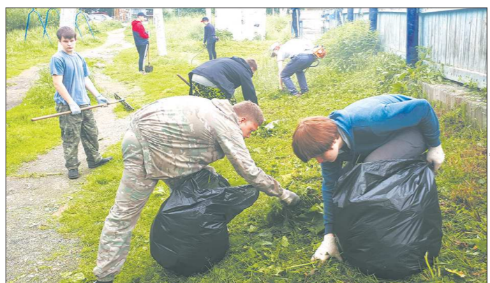
«Трудовые отряды мэра» в Ревде выполняют посильную работу по благоустройству