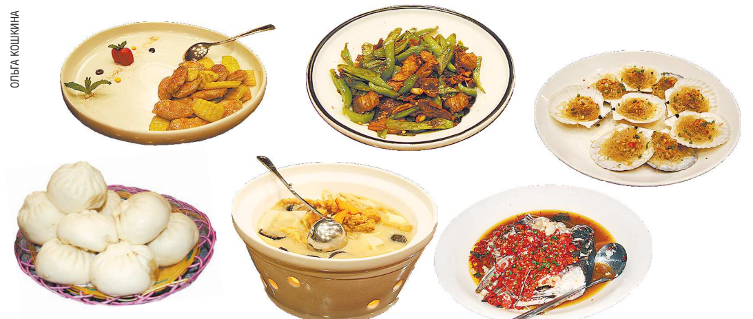
Разнообразие китайской национальной кухни настолько велико, что с ней вряд ли может сравниться любая другая кулинария