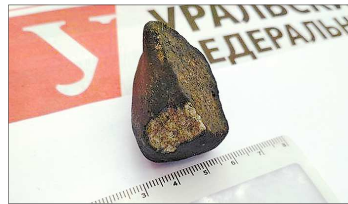
Один из трёх найденных осколков