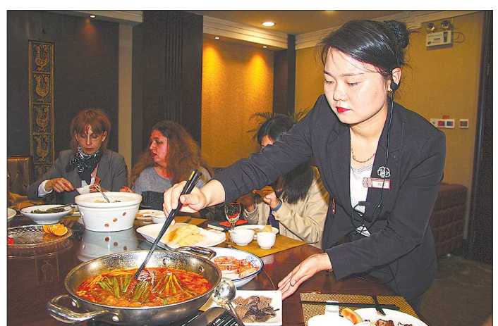
В китайских ресторанах широко распространён хот-пот: ингредиенты опускают в кастрюлю с кипящим бульоном прямо на обеденном столе