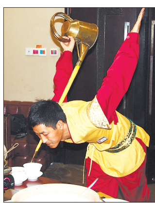
Подача чая тоже может быть искусством: вот так мастер по завариванию чая разливает напиток во время движения кунг-фу