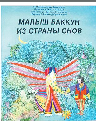
Отрывок из книги: «Далеко-далеко, по ту сторону радуги, за облаками, есть волшебная страна. Там живут единороги, драконы и прочие диковинные звери. А ещё в той стране живут удивительные существа под названием баку. У них тело как у медведя, хобот как у слона, хвост как у быка, а лапы совсем как у тигра. И едят они не обычную пищу, а страшные сны, которые порой снятся людям. К этому удивительному племени принадлежит и малыш по имени Баккун. Каждый день его родители уходят на охоту и Баккун остаётся один – он ещё слишком мал, чтобы сражаться со страшными снами.

– Когда я вырасту, – мечтает малыш, – тоже стану охотником и не оставлю на свете ни одного плохого сна!...»