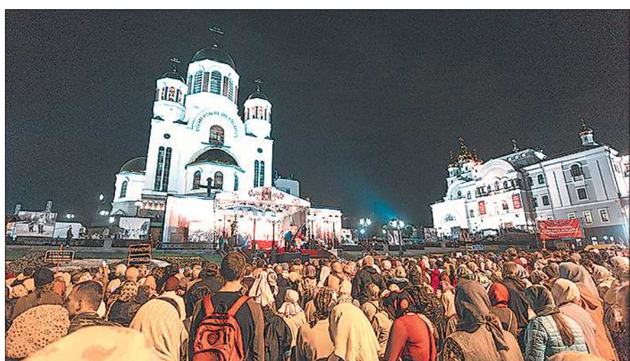
В прошлом году крестным ходом от Храма-на-Крови до Ганиной Ямы прошли 60 тысяч человек

Ключевым событием Царских дней станет и XVII Фестиваль православной культуры «Царские дни», в рамках которого пройдут различные концерты российских и зарубежных кол-