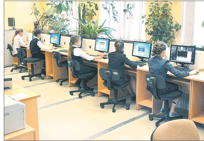
Школы Екатеринбурга №35, 70, 145 получили из федерального бюджета по миллиону рублей на инновации

– Да. 1 сентября примет учеников новый большой корпус школы №23 в Академическом микрорайоне. Для этой территории как минимум нужны ещё три школы