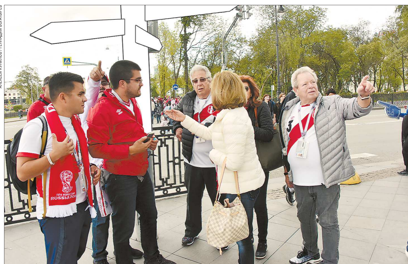
Пока указателей в Екатеринбурге действительно не хватает. Что на русском, что на английском. Поэтому ориентироваться в городском пространстве туристам помогают местные жители

Что нужно сделать, чтобы Екатеринбург смог принять ещё больше иностранных туристов?