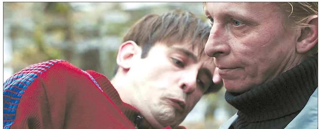
Фильм «Временные трудности» выходит в прокат 11 октября. Вероятно, после выхода на большой экран картина об отношениях отца и сына станет очень резонансной, и уже по всей стране