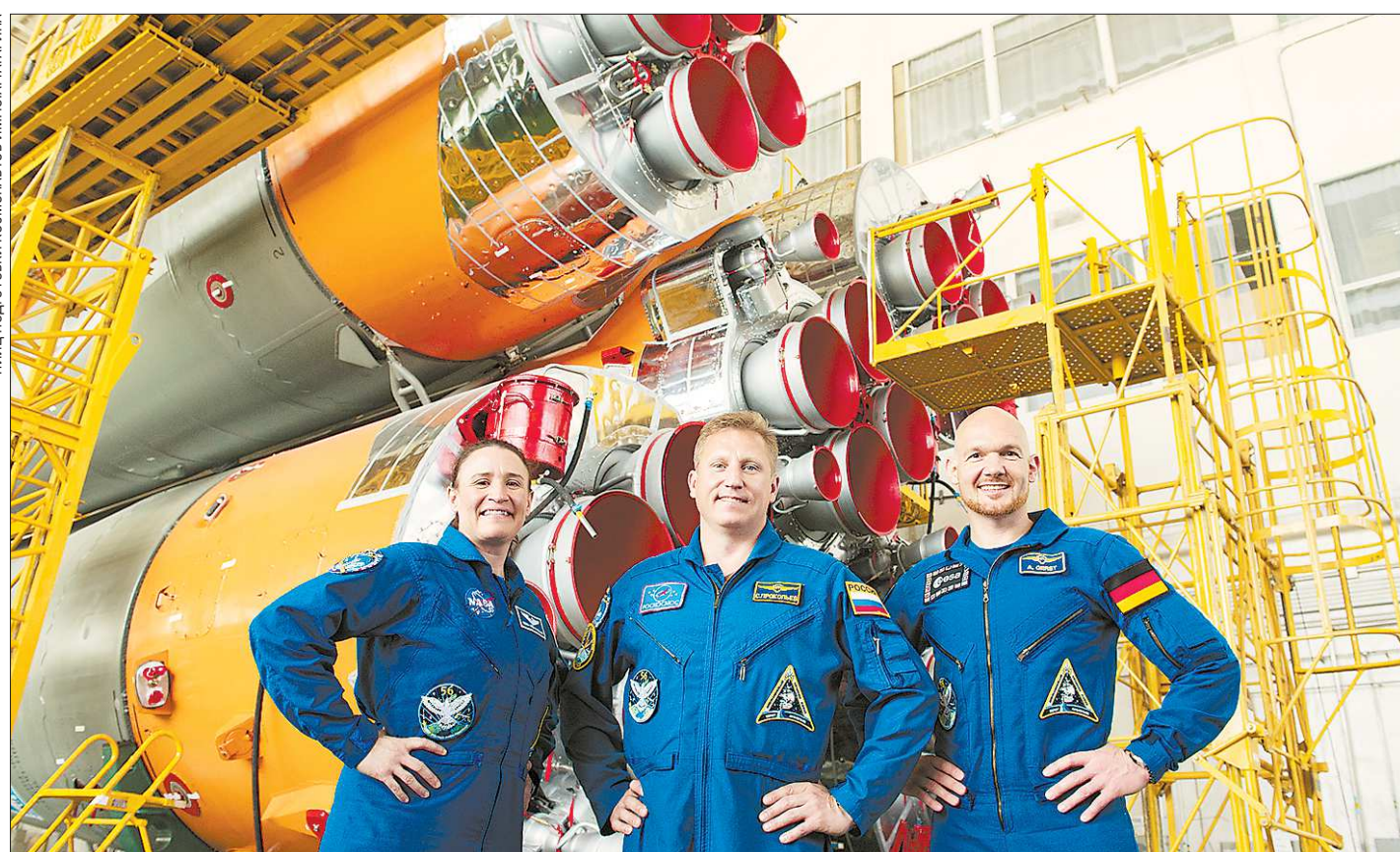
Основной экипаж корабля «Союз МС-09»: бортинженер Серина Ауньон-Чэнселлор (НАСА), командир экипажа Сергей Прокопьев (Роскосмос) и бортинженер Александр Герст (Европейское космическое агентство)

Вчера на космодроме Байконур состоялся запуск пилотируемого корабля «Союз МС-09». Экипаж, который отправился на Международную космическую станцию, возглавил наш земляк Сергей Прокопьев. За всю историю освоения космоса в звёздную даль прежде летали четыре человека, связанных со Свердловской областью. Прокопьев - первый космонавт родом из Екатеринбурга