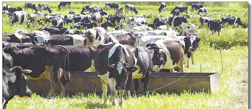
Лабораторные исследования молока, которое производится в Свердловской области, подтверждают его пользу для здоровья

– И это очень плохо. Наши родители при помощи правильного рациона питания заложили хорошее здоровье и крепкую костную массу с высокой плотностью – у нас. Мы же такого подарка своим детям не делаем, и это – крупная ошибка. Пищевое поведение в семьях значительно изменилось: сегодня вместо полезного молока в холодильниках – разнообразные сладкие напитки, зачастую газированные. Их высокая