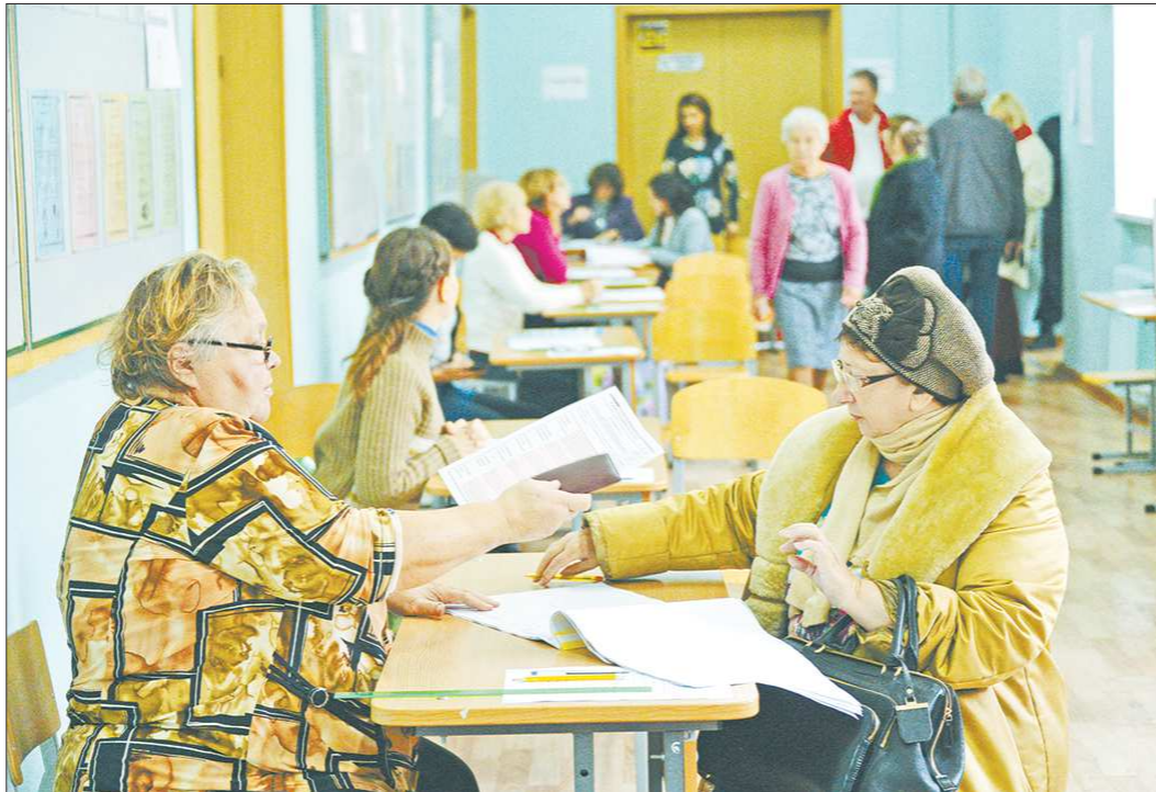
Избирательные участки будут работать с 8 утра до 8 вечера. Каждый будет оборудован специальными урнами и кабинками для голосования

По всем помещениям, где будут располагаться избирательные участки, вне зависимости от того, в муниципальной, областной или частной собственности они находятся, составлены договоры аренды, и они будут оплачены.