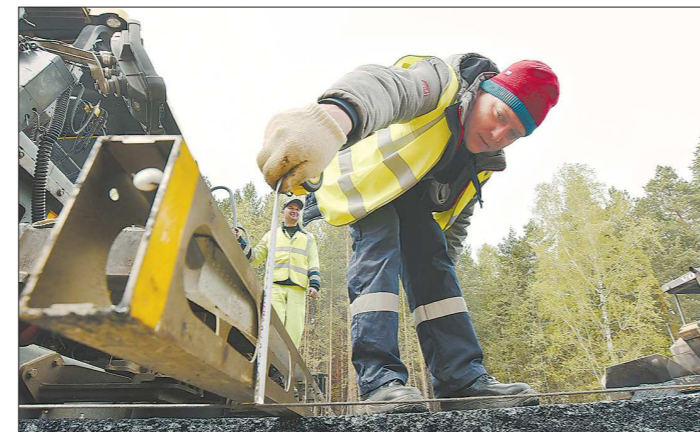
Толщину слоя органоминеральной смеси при укладке замеряют рулеткой

Органоминеральная смесь хорошо скрепляет частично повреждённую бетонную конструкцию, равномерно передаёт нагрузку и обеспечивает устойчивость к образованию таких деформаций, как колеи и трещины, – пояснил вчера журналистам главный ин-