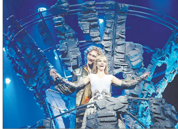
Орфей и Эвридика – контрастируют с окружающей их реальностью. Декорации создают атмосферу мира, где нет гармонии

Постановщики и сами начали с разрушения – разрушения стереотипов об этом спектакле, уйдя от знаменитого зелёного абажура и кремовых штор. Вместо них на сцене под самый потолок уходят стальные плиты, нависшие прозвеневшие штыками. Время от времени в этих