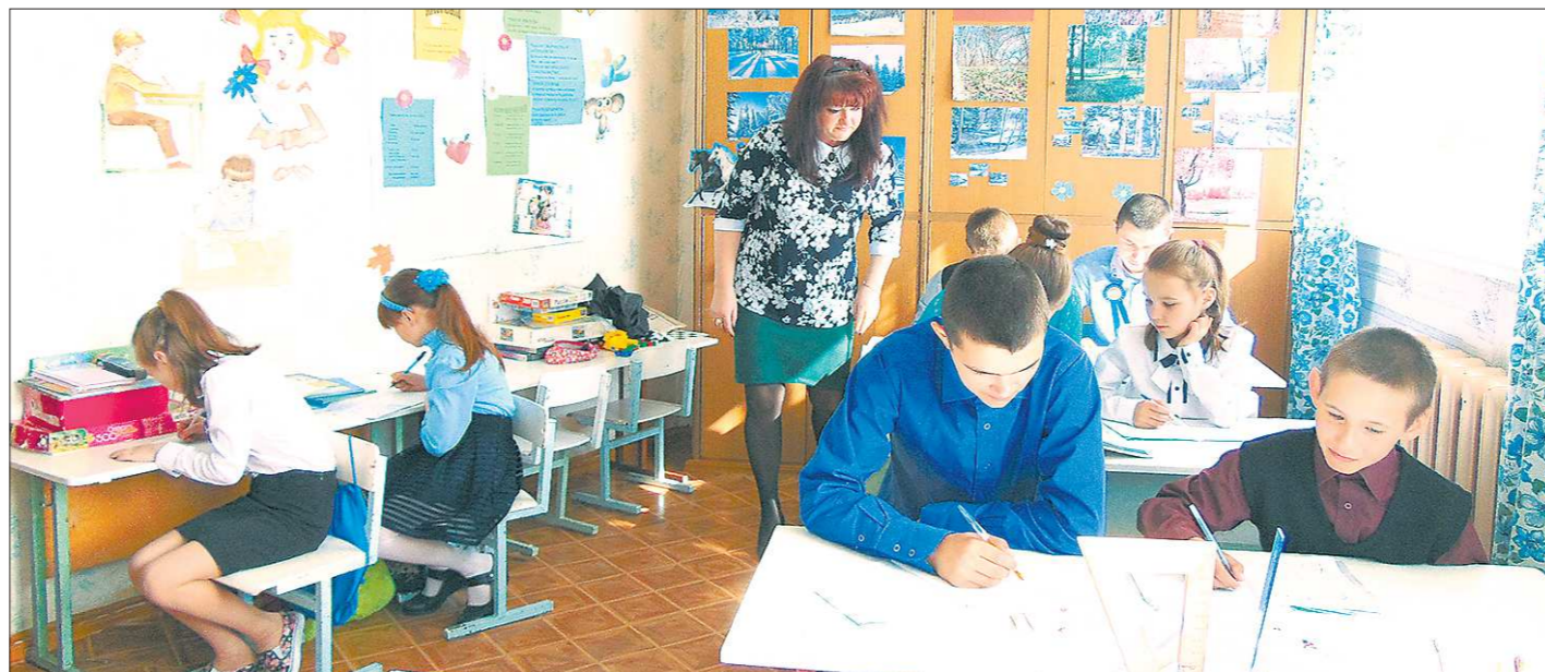
Редкое явление: ученики школы практикуют в полном составе собираются в одном классе