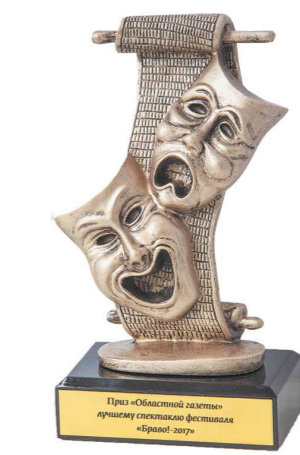
Так выглядит приз «Областной газеты», который наше издание впервые будет вручать лучшему, по нашему мнению, спектаклю «Браво!»

Спектакль можно увидеть в двух версиях, и обе они настолько хороши, что трудно выбрать: в первой версии Кису Воробьянинова играет сам