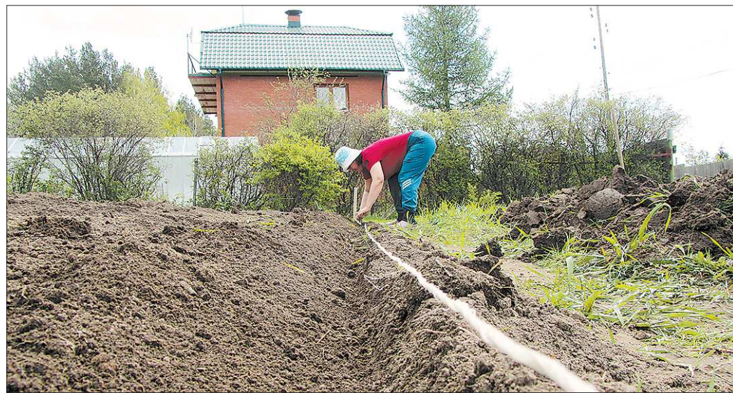
Перед тем как садить картошку, лучше натянуть шнур, чтобы были ровные гряды

В зависимости от сорта, конкретного участка эти параметры могут варьироваться. Если говорить об общепринятой методике, то обычно рекомендуется высаживать картофель на расстоянии 75 сантиметров между рядами, а меж-