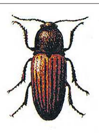
Насчитывается несколько десятков видов жука-щелкуна

Не хочу комментировать полезность тех или иных препаратов, единственное, что могу сказать: они не защищают картофель на весь вегетационный период. Действие любого из них длится месяц-полтора. Но этого хватает для того, чтобы защитить картофель и от колорадского жука, и от проволочника, и от всевозможных видов парши в этот период. Но использовать ли на садовых участках такие средства защиты растений, каждый должен решать сам.