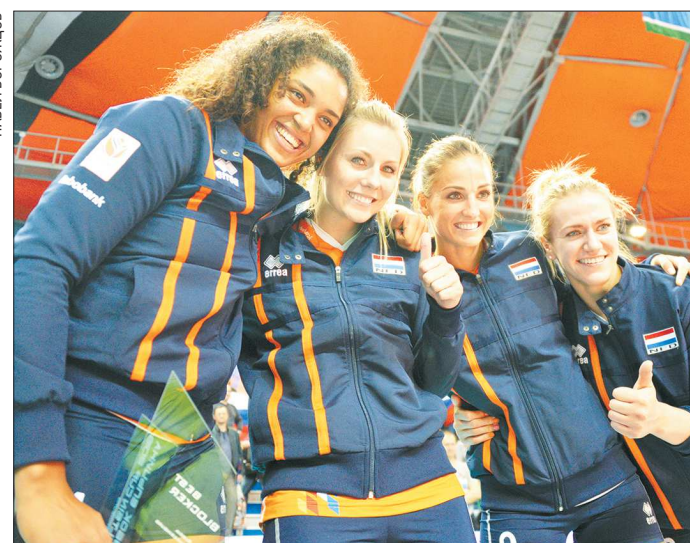
Солнечные улыбки девушек из «оранжевой» команды Нидерландов