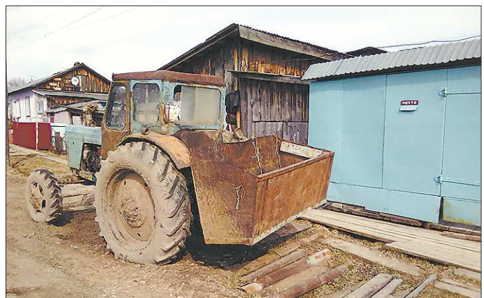
Чаще всего жителям Андрюшино приходится добираться до Гарей на тракторе с самодельным ковшем