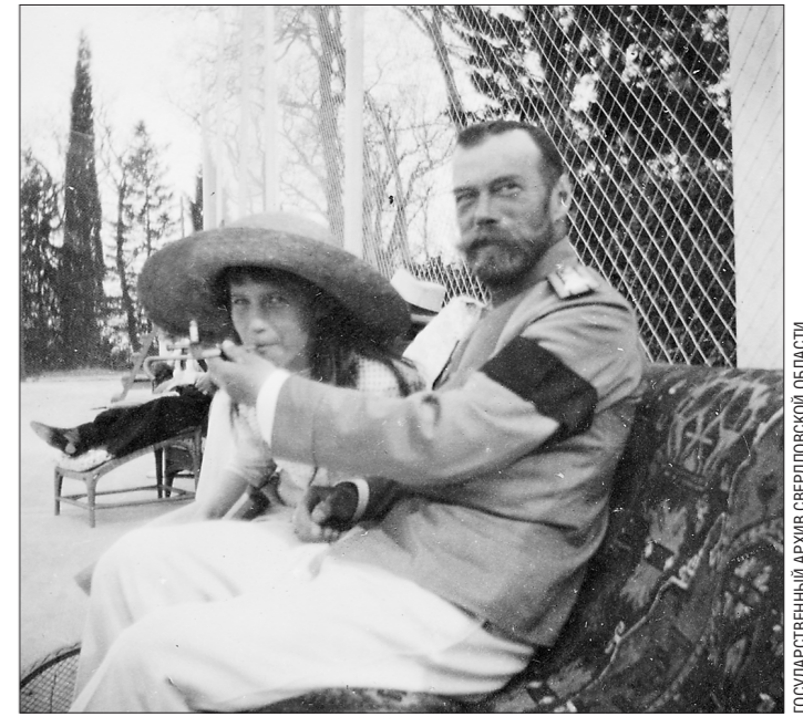
Николай II в шутку дал затянуться папиросным дымком дочери – великой княжне Анастасии. Могилёв, лето 1916 года

Действительно, в конце XIX – начале XX веков средняя продолжительность жизни в России составляла 30 – 40 лет, так что дожить до 50 лет было и удачей, и собственным достижением, говорят историки.