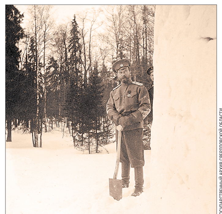
Император Николай II не гнушался простого физического труда. Любил пилить и колоть дрова, а на этом снимке запечатлён во время строительства снежной крепости