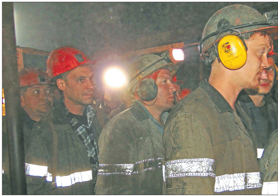
Традиционно рейтинг опасных профессий в России и области возглавляют шахтеры