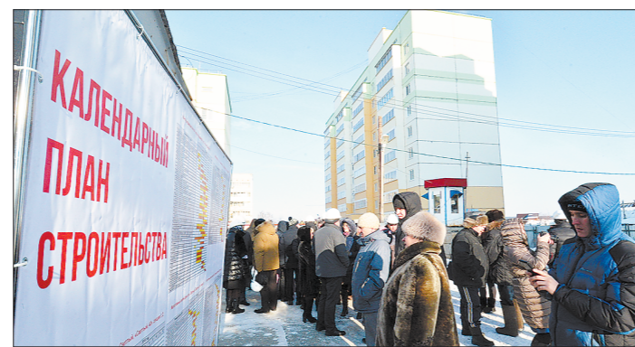
Очередь обманутых дольщиков в регионе стремительно сокращается

Накануне министр строительства и развития инфраструктуры Михаил Волков провёл заседание на площадке долгостроя по адресу Бахчиванджи, 15, где вместо недостроенного застройщика был привлечён новый инвестор. В ближайшее время строители планируют при-