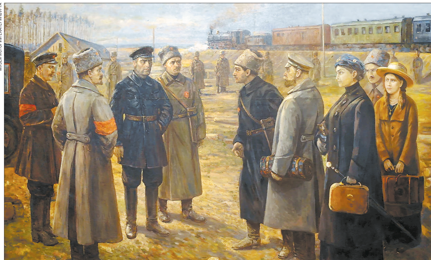
«Передача семьи Романовых Уралсовету». Художник В.Н. Пчелин. 1927 год

Сегодня – 150 лет со дня рождения последнего российского императора