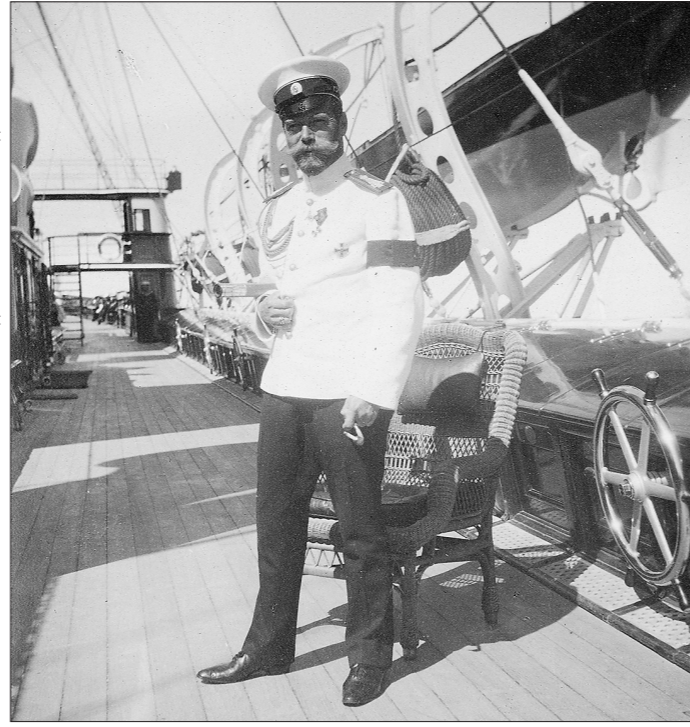
Император на своей любимой яхте «Штандарт». Он вообще любил плавать, особенно на байдарке. 1916 год