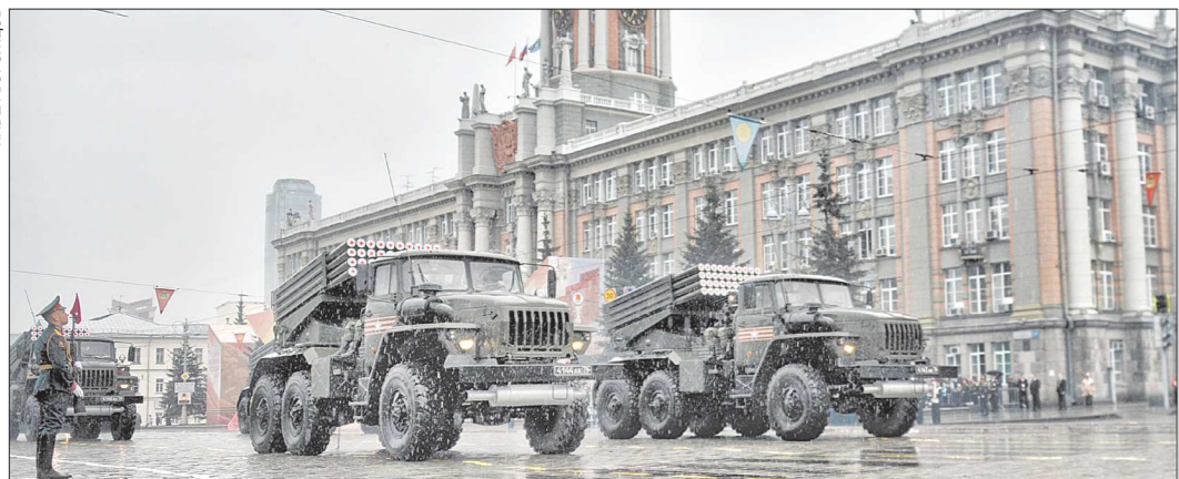
Реактивные системы залпового огня — преемники легендарной «катюши»