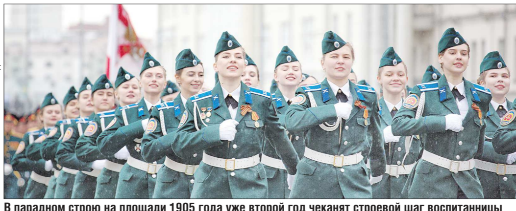
В парадном строю на площади 1905 года уже второй год чеканят строевой шаг воспитанницы Екатеринбургского кадетского корпуса Национальной гвардии России