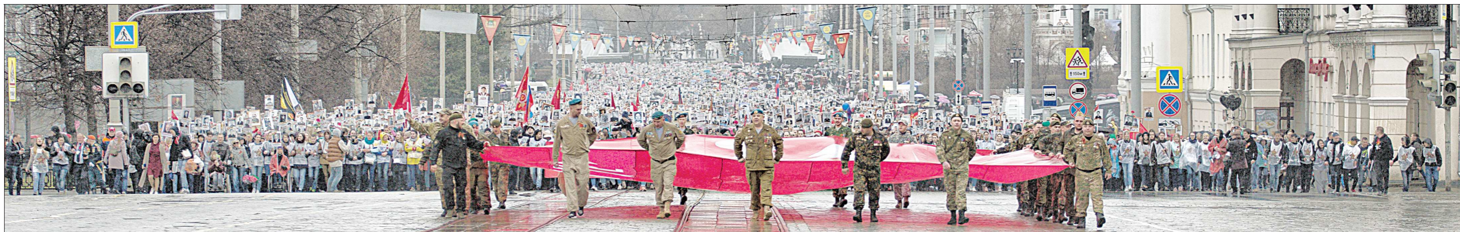
Год от года прирастают ряды Бессмертного полка не только на Урале, но и во всей стране, и даже во всём мире. Около 150 тысяч екатеринбуржцев и гостей города прошли с портретами родственников-фронтовиков. Колонна растянулась на несколько километров. Начало её уже дошло до конечного пункта — сквера у Дворца молодёжи, хвост колонны Бессмертного полка ещё только начинал своё движение с улицы Толмачёва