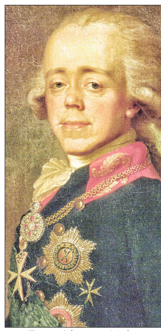
Павел I (1754-1801) – император Всероссийский с 1796 по 1801 год. Убит в возрасте 46 лет. Все ныне живущие Романовы – потомки Павла I