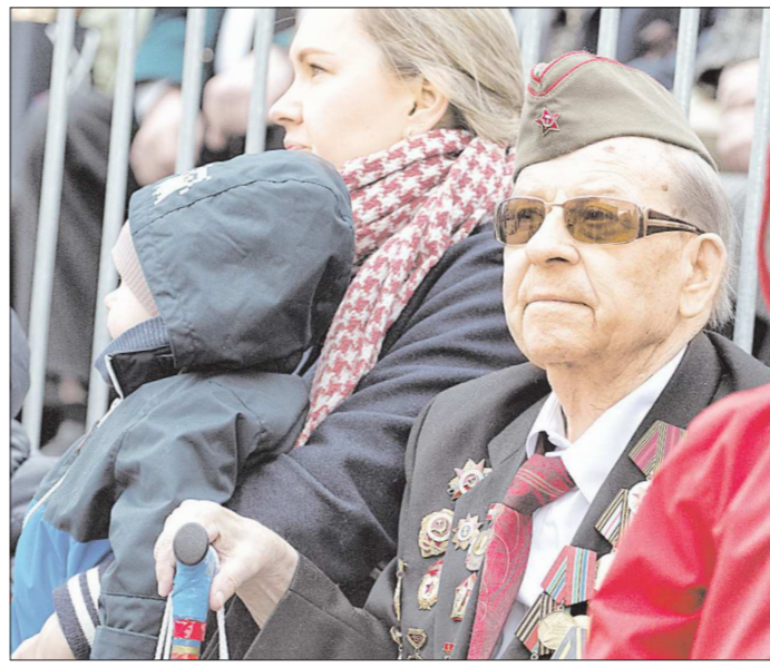
День Победы объединяет все возрасты. В России нет ни одной семьи, которой не коснулась бы прошедшая война