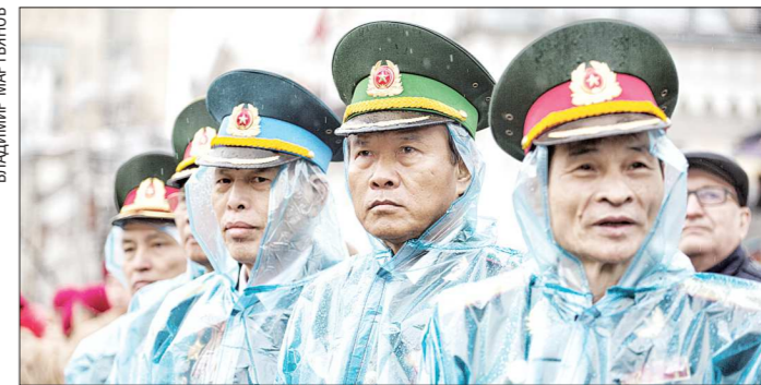
В праздничных торжествах приняла участие делегация Вьетнамской народной армии, прибывшая в Екатеринбург по приглашению командования Центрального военного округа