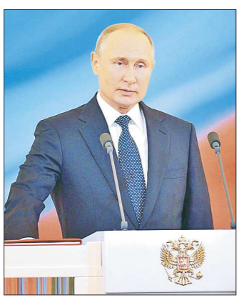
Владимир Путин присягнул народу России, положив руку на текст Конституции РФ