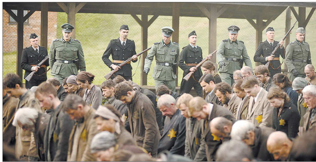
КАДРЫ ИЗ ФИЛЬМА «СОБИБОР». РЕЖ. КОНСТАНТИН ХАБЕНСКИЙ