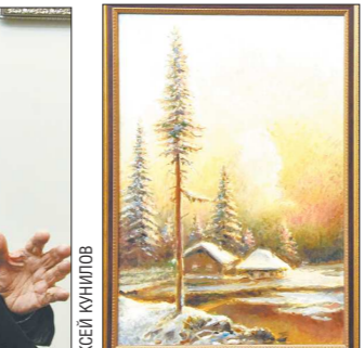
Любимый жанр у фронтовика — наш русский пейзаж

ловск и сразу же поступил в художественное училище имени Шадра. Склонность к рисованию у него была с детства, и проблемы, кем стать во взрослой жизни, для него не существовало. Вот только война немного отодвинула профессиональное становление. Хотя, как сказать... — Во время подготовки опе-