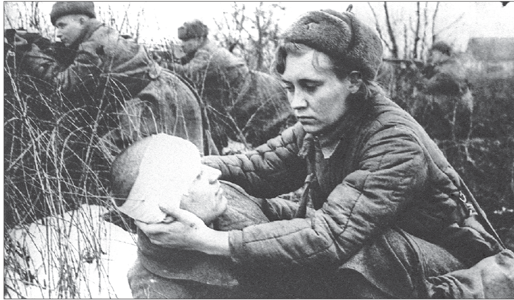
Великая Отечественная война, 1945 год. Санитарструктор перевязывает раненого

И ещё один эпизод помню всю жизнь. В конце зимы 1943 года нас перебросили на Ленинградский фронт. Попав в Ленинград мы могли только по Дороге жизни — через Ладожское озеро. Лёд был уже тонкий. Мы всю ночь шли пешком, и каждую минуту была опасность провалиться под лёд. Всем строго