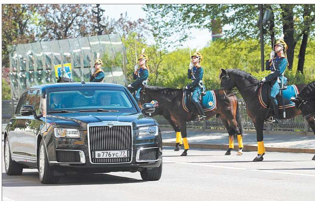
В Большой Кремлёвский дворец Владимир Путин прибыл на новейшем лимузине отечественного производства