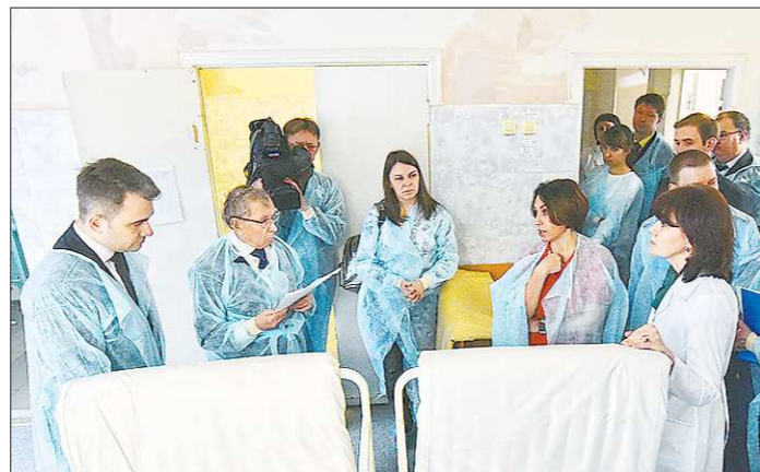
В помещениях Детской горбольницы №15 после приезда проверяющих проведут ремонт