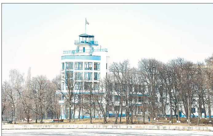
Спорткомплекс «Динамо» (Екатеринбург) может попасть в список культурного наследия ЮНЕСКО

— В городе около 500 таких объектов, некоторые из них включаются в себя несколько строений. Так, в усадьбе Харитонов, кроме главного дома, есть два флигеля, если считать подобные составные части, можно сказать, что у нас порядка 700 объектов. В собственности муниципалитета находится 123 из них. В администрации города разработан стратегический проект сохранения объектов культурного наследия. В соответствии с ним с 2012 года планомерно ведутся ремонтные и реставрационные работы. К примеру, были отремонтированы фасады Музея истории Екатеринбурга и Музея Метелкова. Хороший ремонт был проведён в Доме Петровых — уникальном с архитектурной точки зрения особняке, расположенном на улице Февральской Революции. Сейчас там размещается клуб «Каравелла». Владислав Крапивин был там и очень порадовался за ребят, которые получили такое замечательное отремонтированное здание. Большой комплекс работ был выполнен