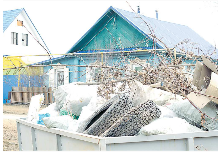
Те, кто отказывается платить за вывоз мусора, утверждают, что сжигают или закапывают отходы. Но свалки из стекла, пластика и макулатуры на обочинах и за сёлами почему-то всё равно растут