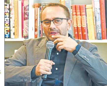
Также Андрей Звягинцев имеет награды премий «Золотой орёл», «Ника», «Сезар» и Венецианского кинофестиваля

Также картины основного конкурса будут судить китайский актёр Чанг Чань , американский писатель, режиссёр и продюсер Ава Дюверней , певица Хаджа Нин из Бурунди, французская актриса Леа Сейду , американская актриса Кристен Стюарт , французский режиссёр Робер Гедигян , канадский режиссёр Дени Вильнев . Имена лауреатов Каннского фестиваля этого года будут объявлены 19 мая. Фильмы Андрея Звягинцева неоднократно участвовали в киносмотре. В 2007 году приз Каннского фестиваля за лучшую мужскую роль получил Константин Лавроненко , сыгравший в его картине «Изгнание». В 2014-м режиссёра наградили за сценарий к фильму «Левиафан», а в 2017-м его «Нелюбовь» была удостоена приза жюри.