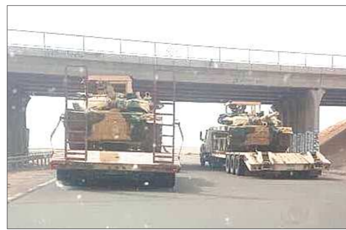
Танки Т-90 российского производства, прибывшие морским транспортом 15 февраля 2018 года из России, следуют в Багдад

— Да, да, конечно! Россия для нас очень важный стратегический партнёр.