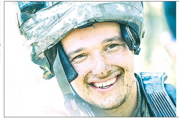
Сергей Карякин: «Я часто встречаюсь со школьниками. Хочу стать для них идеалом спортсмена»

Скорее всего, «Шёлковый путь» станет реальной тренировкой перед «Дакаром» в новом для Сергея классе. С 15 июля гонщики из Пекина поедут в Москву. В нём принимают участие сильнейшие спортсмены со все-