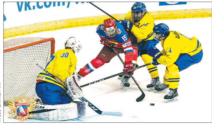
Сборная России перед чемпионатом мира провела контрольный матч со Швецией и одержала победу

Пока неизвестно, какой репертуар представят приглашённые звёзды, оглашение лишь очерёдность их выхода: Дельфин, «Би-2», Земфира, «Сплин». Цена билета зависит от выбора зоны (фан-зона, танцевальный партер, сидячие места) и варьируется от трёх до восьми тысяч рублей. К слову, если на фестиваль «Маяк» вход платный, то на выступления в другие дни, например, на концерт группы «Чайф», можно попасть бесплатно. На этом спорте не заканчиваются: на финал чемпионата мира по футболу пригласили диджея с мировым именем, каково именно — узнаем ближе к старту турнира.