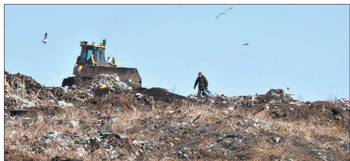
В настоящее время в Свердловской области накоплено от 30 до 50 миллионов тонн отходов