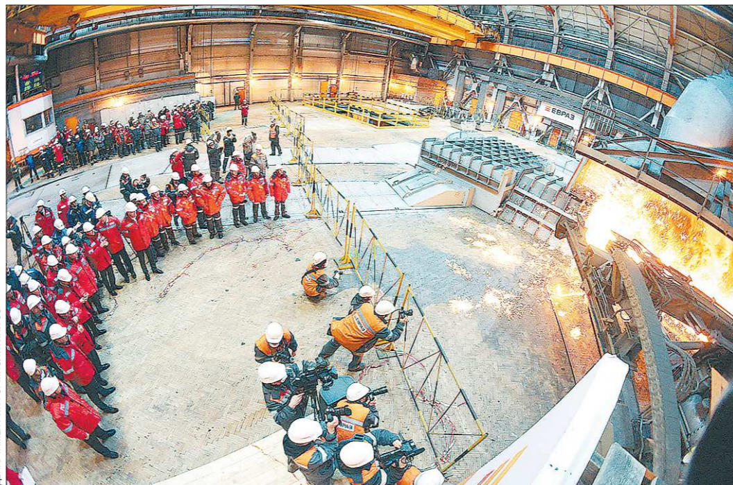
Новая печь будет давать 2,5 миллиона тонн чугуна в год

По типу новая домна — родная сестра двух работаю-