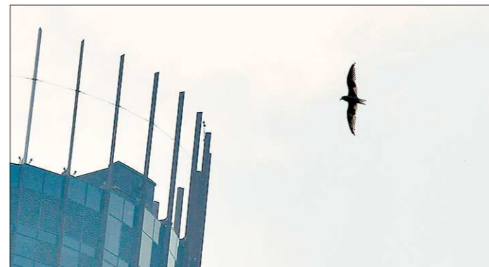
В апреле в небе над Екатеринбургом можно увидеть одиночек стрелов и орланов-белохвостов, которые возвращаются домой с зимовья из Средней Азии