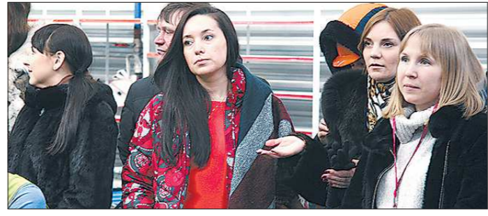
выборов — самому решить судьбу своей страны.

В ходе встречи с министром была затронута волнующая горожан тема предстоящих выборов. А участвовать в них необходимо всем гражданам России. Самая главная причина, и она обусловлена Конституцией РФ, — возможность влияния на власть, участвуя в управлении государством. Кто, как не избиратели, могут запустить процесс перемен? Поскольку выборы президента проходят раз в шесть лет, стоит отдать свой голос кандидату, которому доверяешь, — за этот срок он сможет изменить жизнь к лучшему. Немаловажно и волнение людей за собственное будущее, за будущее своего города и страны, а значит участие в выборах — это уже позиция неравнодушного гражданина. Ещё один повод прийти на избирательный участок в день