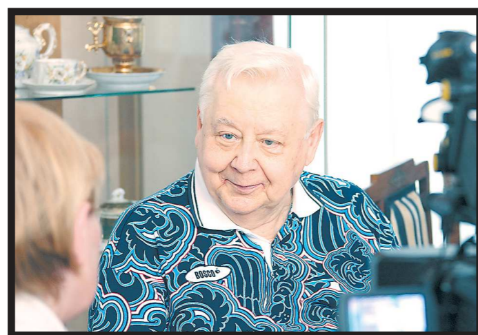
Олег Табаков всего себя отдавал театру. Последний раз он вышел на сцену 17 ноября 2017-го. Через 10 дней его госпитализировали...

Что интересно, идя по жизни, мы раз за разом на каждом новом отрезке открывали для себя нового Табакова — сначала это был голос кота Матроскина из мультфильма «Трое из Простоквашино». Да что там голос, сам характер получился настолько табакковским, что этот образ прилип к актёру на всю оставшуюся жизнь крепче, чем роль Штирлица в фильме «Несколько дней