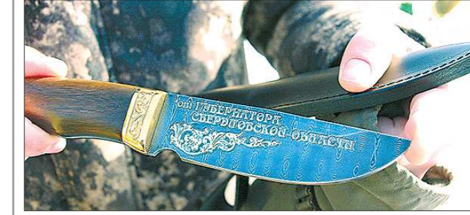
Призы самому молодому «биатлонисту» (охотничий нож — на фото) и самому опытному (книга «Опорный край державы») выделил губернатор Свердловской области Евгений Куйвашев.

В турнире участвовали 17 команд из Екатеринбурга, Краснофимского и Ачитского городских округов. На старт выехали команды по 5 человек, у каждого было охотничье ружьё 12-го калибра и охотничьи лыжи шириной не менее 10 сантиметров. Соревновались спортсмены-любители на дистанции 1,5 километра с тремя огневыми рубежами: статичная мишень, «бегущий кабан» и выстрел по летящей тарелочке на стенде