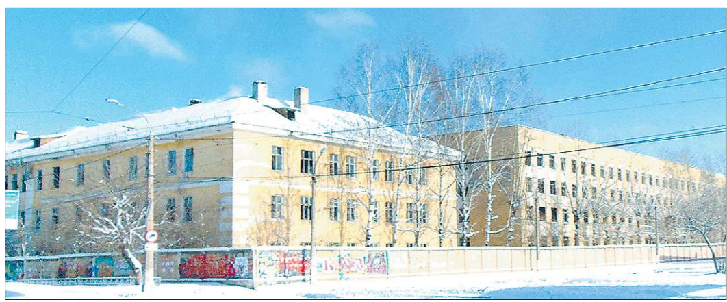
Неприглядные корпуса бывшей воинской части скоро перестанут мозолить глаза тагильчанам