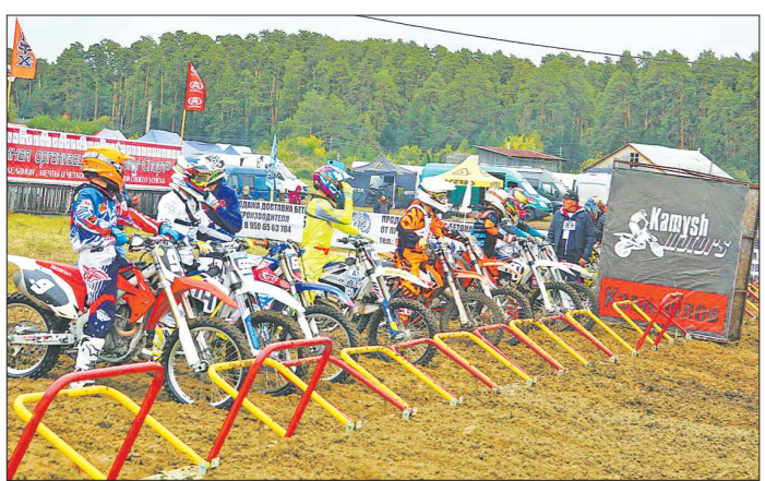
В сентябре прошлого года Камышлов принимал финал чемпионата России по мотокроссу

вообще её устанавливает? ФИФА некуда девать деньги? Уже много было сказано о плюсах и минусах этой системы, и, возможно, через какое-то время мы привыкнем к тому, что судьи после каждого спорного момента будут смотреть повторы. Но пока эта система тестируется, нет никакого смысла тратить приличные суммы на установку VAR на двенадцать стадионов. Чемпионат мира — не турнир для экспериментов, а главное футбольное событие четырёхлетия.