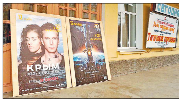
3D-кинотеатр в Верхней Туре открыли в октябре: теперь жителям не надо ездить на кинопремьеры в соседние города

У качанарцев также есть богатый опыт частной инициативы в кинопрокате. Там несколько лет работал кинозал в ДК, но под тяжестью долгов в конце 2016 года закрылся, при