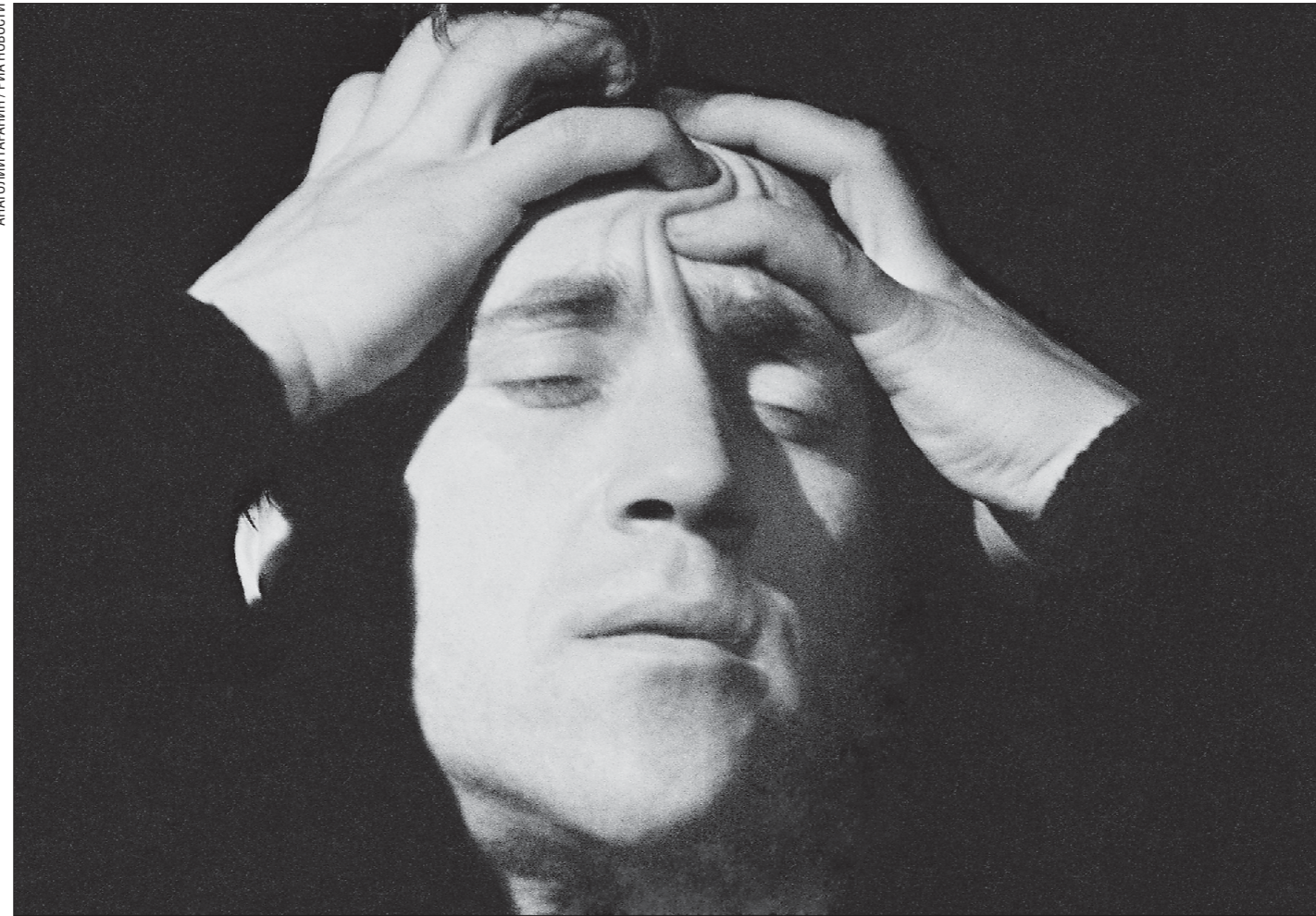
Владимир Высоцкий в роли Гамлета в спектакле Театра на Таганке

Сегодня — 80 лет со дня рождения Владимира Высоцкого