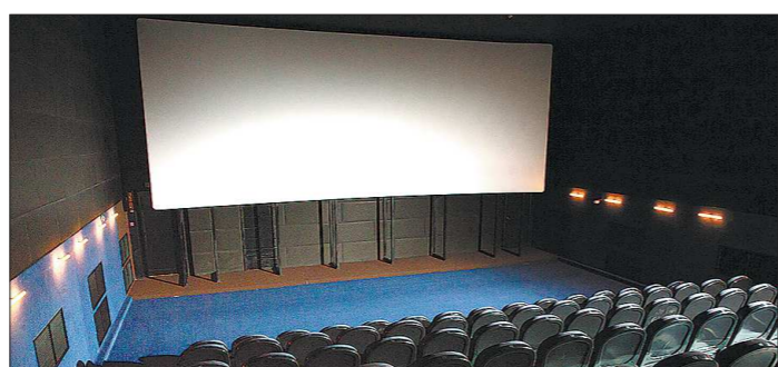
Кинотеатр в Североуральске стал убыточным, но жители настаивают на его поддержке

Церемония вручения премии «Итоги года Урала и Сибири 2017» пройдет в Тюмени 26 января.