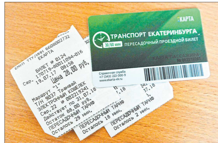
При использовании Екарты с повременным тарифом на квитанциях отображается время, которое можно использовать для пересадки

— В конце января можно будет либо приобрести новую Екарту, либо перепрограммировать имеющуюся. Отмечу,