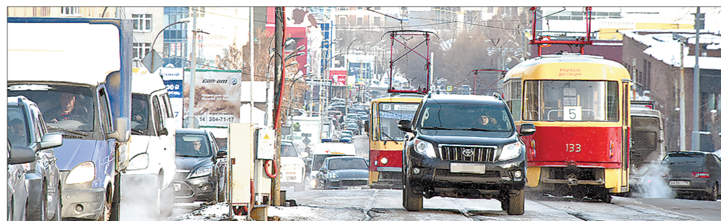
В 2018 году над трамвайными путями в центре Екатеринбурга будут устанавливаться камеры, чтобы ловить водителей, гонящих по рельсам. Без этого обособление трамвайных путей разметкой не даёт результата