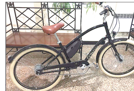
Губернатор сообщил, что будущей весной купит себе новый велосипед и вновь появится на нём на улицах Екатеринбурга

Глава Свердловской области Евгений Куйвашев примет участие в благотворительной акции. Вырученные деньги пойдут на создание рабочих мест для людей с ментальной инвалидностью.