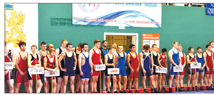
В этом году в турнире приняли участие спортсмены из многих регионов России