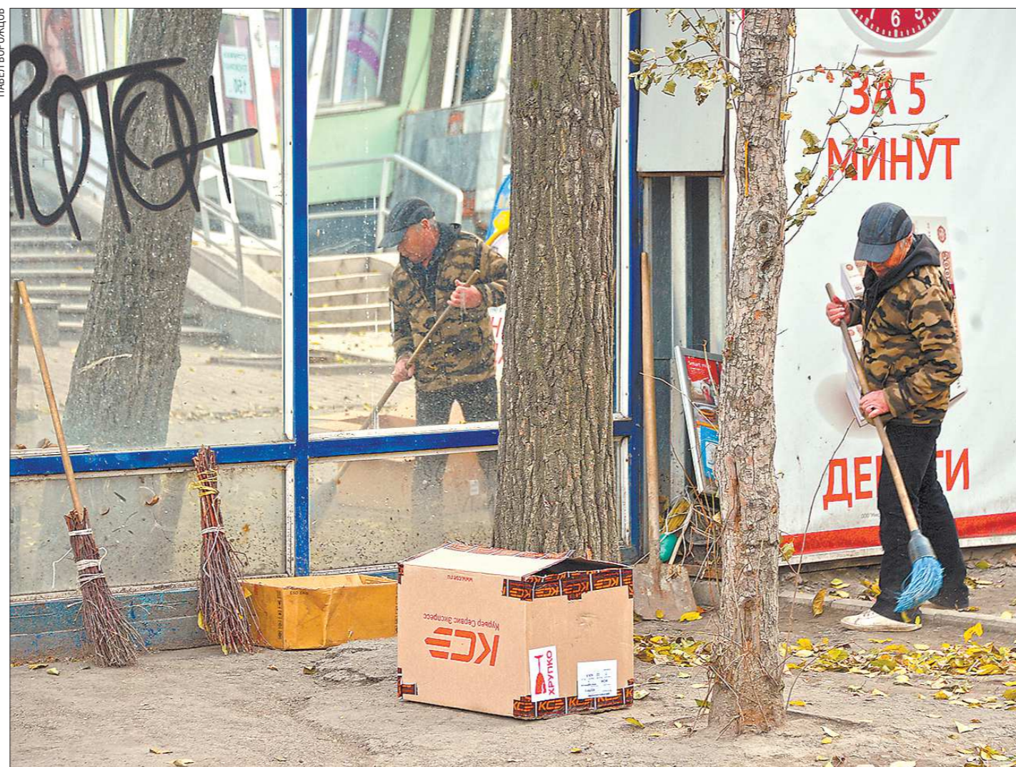
«Визуальный» мусор и мусор под ногами развязывают руки вандалам, ведь кажется, что такое состояние городской среды — норма

В конце минувшей недели в Екатеринбурге состоялось заседание межведомственной комиссии по реализации проекта «Формирование комфортной городской среды».