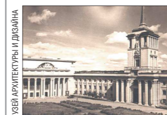
МУЗЕЙ АРХИТЕКТУРЫ И ДИЗАЙНА

Это основная экспозиция проекта «Дни конструктивизма на Урале», который уже стал для Екатеринбургa традиционным и проходит в третий раз. В этом году главная тема проекта — профсоюзные клубы и дома культуры, построенные на рубеже 1920–1930-х годов. На выставке представлены дизайнерские макеты свердловских клубов, исторические документы, рассказывающие об успехах и проблемах в их работе. Артефакты и фотографии тех времён помогут гостям почувствовать атмосферу эпохи. Помимо выставки, посетители в рамках Дней конструктивизма ожидают лекции, экскурсии, круглые столы, интерактивы и другие мероприятия с участием местных и приглашённых экспертов. Адрес: Музей архитектуры и дизайна УрГАХУ (Екатеринбург, ул. Горького, 4а). Со 2 октября по 5 ноября.