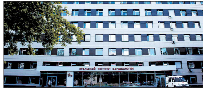
10 октября в Уральском институте кардиологии пройдёт Научно-практическая конференция «Инновации в кардиологии, спасающие жизнь»