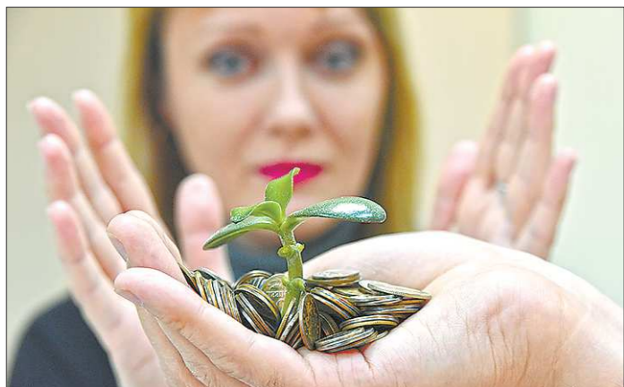
Прогноз доходов консолидированного бюджета на 2018 год, по предварительной информации, составляет 239,5 млрд рублей