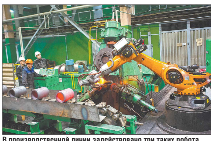
В производственной линии задействовано три таких робота