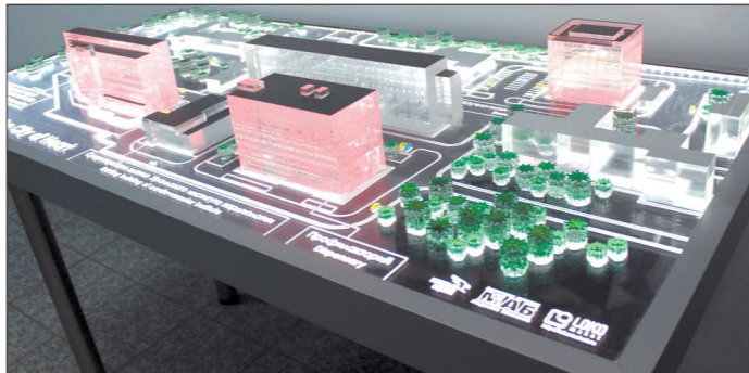
«Город сердца» — проект, призванный сберечь самое ценное — здоровье

— Это обычная в виде электронной карточки или флешки в форме браслета со-