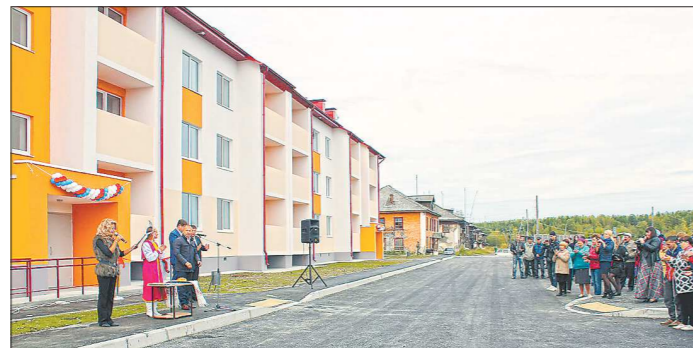
На днях в посёлке Вьюжном заселили новый дом

Посёлок Вьюжный Волчанского городского округа — один из немногих на севере области, который можно назвать территорией опережающего развития (ТОР). Удивительно, но зартавшийся в лесах скромный населённый пункт снабжает молоком всю округу, с размахом справляет новоселья и каждый год получает гранты от министерства культуры Свердловской области. Для села необходимы хорошие дороги, медицина, детские учреждения, но самое главное — наличие рабочих мест. Сельхозпредприятие в посёлке Вьюжном Волчанского ГО стало опорой для местных жителей.