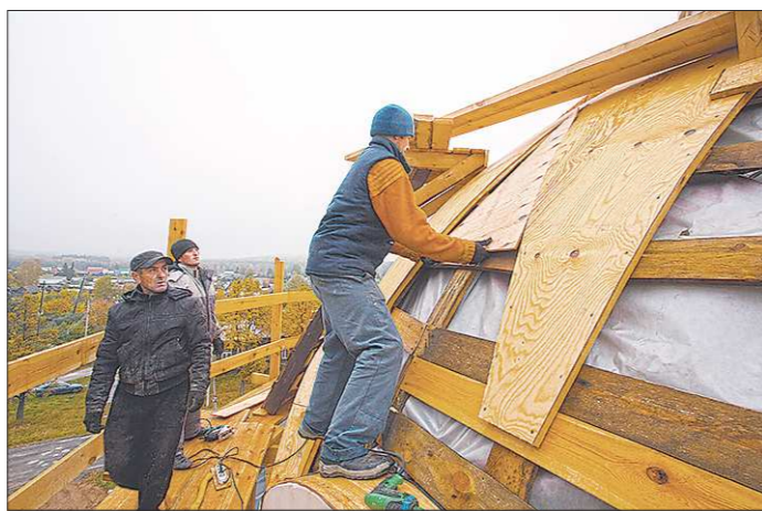
Сейчас на куполе храма идут кровельные работы