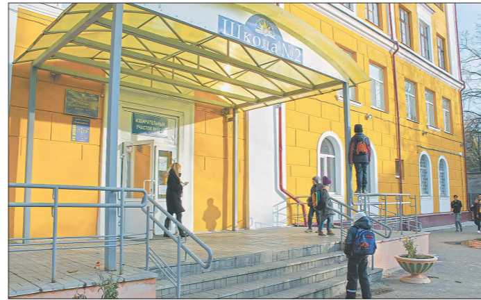
Кабинет заучей и музей в здании второй школы в Берёзовском были перепрофилированы под учебные классы — места детям в центральных школах критически не хватает

КЛАССЫ ПЕРЕПОЛНЕНЫ. Сегодня город-спутник Екатеринбург активно развивается: возводятся новые микрорайоны, идёт миграция населения. Муниципалитет старается расширить количество мест в школах, но без новых зданий не обойтись. В этом году отмечен пиковый прирост школьников — их число увеличилось на 657 человек. Сейчас в школах округа обучается 9 049 человек, 27 процентов из них занимается во вторую смену. Подавляющее большинство «второсменок» составляют младшеклассники: их них 36,6 процента приходится на занятия к обеду. Мы стараемся этого избежать, открываем дополнительные классы, пытаемся обойтись без третьей смены, хотя её прогнозируем, — отметила в разговоре с «ОГ» начальника управления образования Наталья Иванова. В Берёзовском практически вся вторая смена приходится на центральные школы города — №2 и №9, а так-