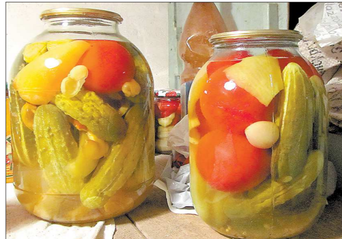
Взрывоопасная ситуация с отзывом лицензий двум крупным уральским банкам не грозит, полагают эксперты

Банк24.ру , один из любимых банков горожан, пополнил список в 2014 году. Банковский сектор не только области, но и страны, потерял одного из самых ярких игроков. Как заявляли тогда в самом банке, «это наказание за грехи прошлого. Мы признаем свои ошибки и вину. Нам очень жаль, что не смогли доказать регулятору глубину и скорость своего исправления. Мы очень старались и многое исправили, тем не менее регулятор принял решение отозвать лицензию». Банк24.ру был, наверное, первым и единственным в России, в ходе ликвидации которого не