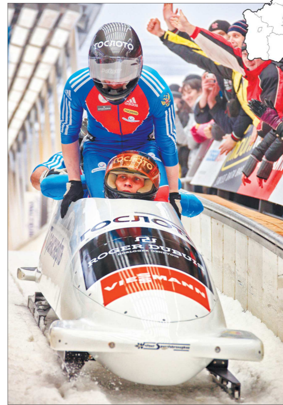
В феврале этого года в Кубке мира по санному спорту в Сочи наша сборная участвовала уже на санках с серовскими полозьями. Проверка прошла успешно