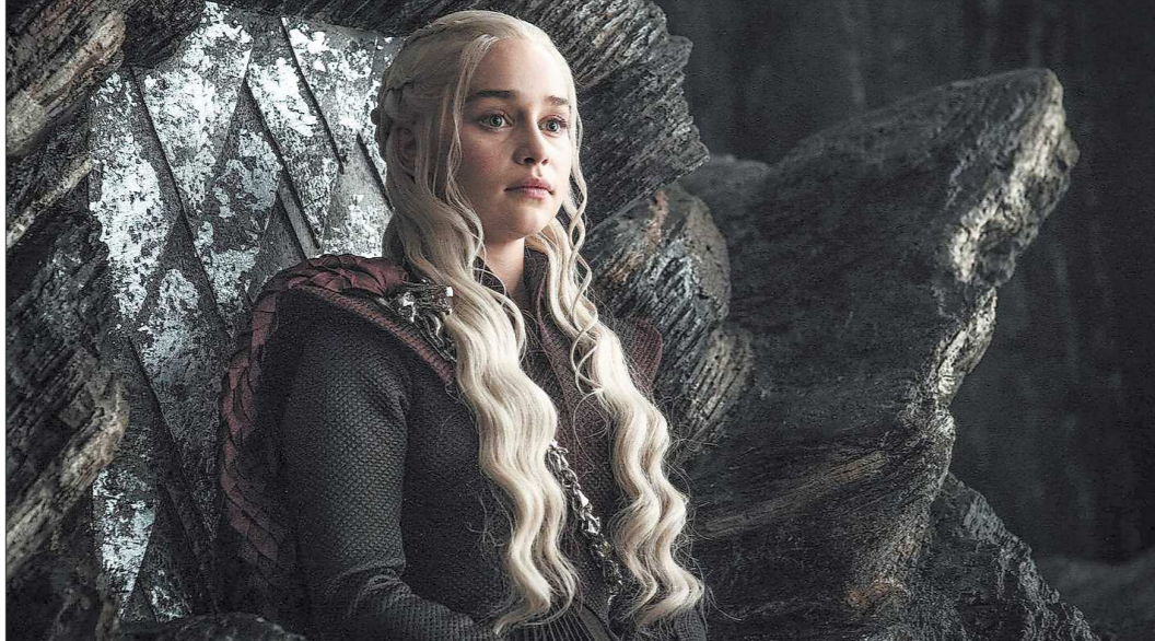
Британская актриса Эмили Кларк в роли Дейенерис Таргариен — Матери драконов

Так в чём же секрет столь сильной всенародной любви? Циники, выслушав восторженный рассказ фанатов про захватывающий сюжет, ро-