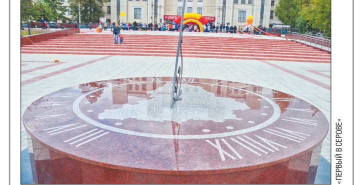
В Серове открылась после реконструкции центральная лестница площади у Дворца культуры металлургов, главным её украшением стали солнечные часы – вторые в области и первые современные

Циферблат трёхметровых часов изготовлен из гранита. В селе Мраморском неподалёку от Полевского сохранились часы конца XVIII века. Они имеют статус культурного наследия. Серовские часы станут интересным арт-объектом, любимым местом для фотосессий. На часах надпись на латыни и русском: «Время летит быстро, не опоздай». Часы предназначены для определения истинного солнечного (астрономического) времени, которое отличается от местного на 1 час