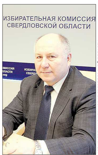
ИЗБИРАТЕЛЬНАЯ КОМИССИЯ СВЕРДЛОВСКОЙ ОБЛАСТИ

10 сентября в Свердловской области пройдет единый день голосования. В воскресенье нам предстоит выбрать руководителя региона — Губернатора Свердловской области. Итоги голосования этого дня определят также состав представительных органов местного самоуправления и руководителей во многих муниципальных образованиях Среднего Урала. Выборы — это всегда событие особой важности. И это не только право, но и великая ответственность: перед самим собой, перед своими близкими, перед всей Свердловской областью. Свободный, независимый и честный голос каждого из нас даст возможность управлять регионом, городом, муниципальным районом избранным нами, таким же заинтересованным в развитии России и Урала гражданам. Не верьте голословным суждениям некоторых псевдополитиков о предопределенности результатов голосования. И уж тем более не доверяйте тем, кто призывает не ходить на выборы. Верьте только себе и своим внутренним убеждениям. Убеждениями и уверенностью в том, что никто, кроме нас самих, не сделает нашу жизнь лучше. Демократия — это право каждого доверить власть достойным людям. Впервые за последние 14 лет мы всенародно будем избирать руководителя региона — Губернатора Свердловской области. Именно поэтому важно сделать свой осознанный выбор. Дорогие уральцы, приглашаем вас 10 сентября на избирательные участки. Ваше будущее — в ваших руках. Валерий ЧАЙНИКОВ, председатель Избирательной комиссии Свердловской области