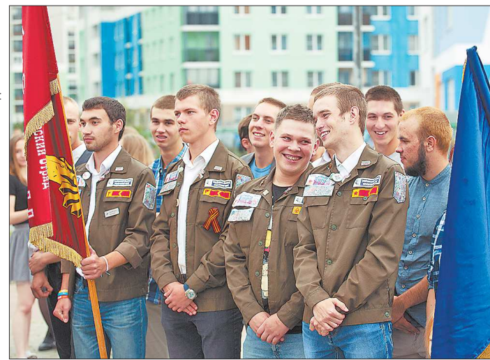
Во Всероссийской стройке «Академический» в этом году приняли участие девять студенческих строительных отрядов из вузов Екатеринбурга.