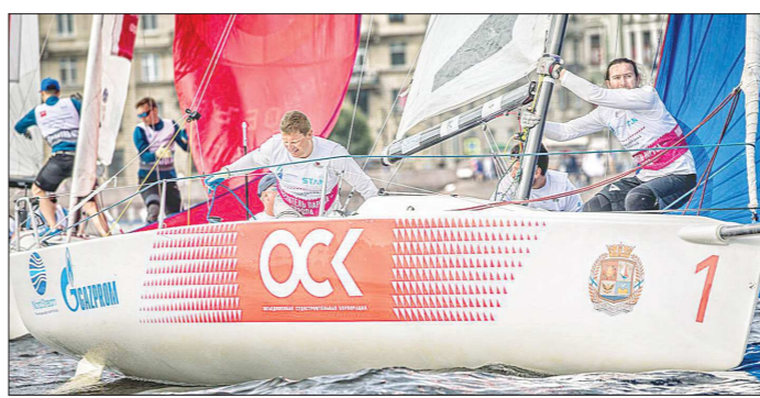
Седьмой этап НПЛ пройдёт в Нижнем Новгороде с 7 по 10 сентября

После трёх дней мы почувствовали усталость и надеялись, что в таком формате гонки не будет, но организаторы решили иначе. Нам сказали, что погода стоит хорошая и прибавили ещё 15 гонок. Мы уже готовы были отпраздновать победу, когда узнали, что придётся вновь выходить на старт. Представьте, что марафонцы говорят: «Ты пробежал 42 километра, но давай ещё восемь сверху». Мы же рассчитываем свои силы, и так делать неправильно, но мы справились.