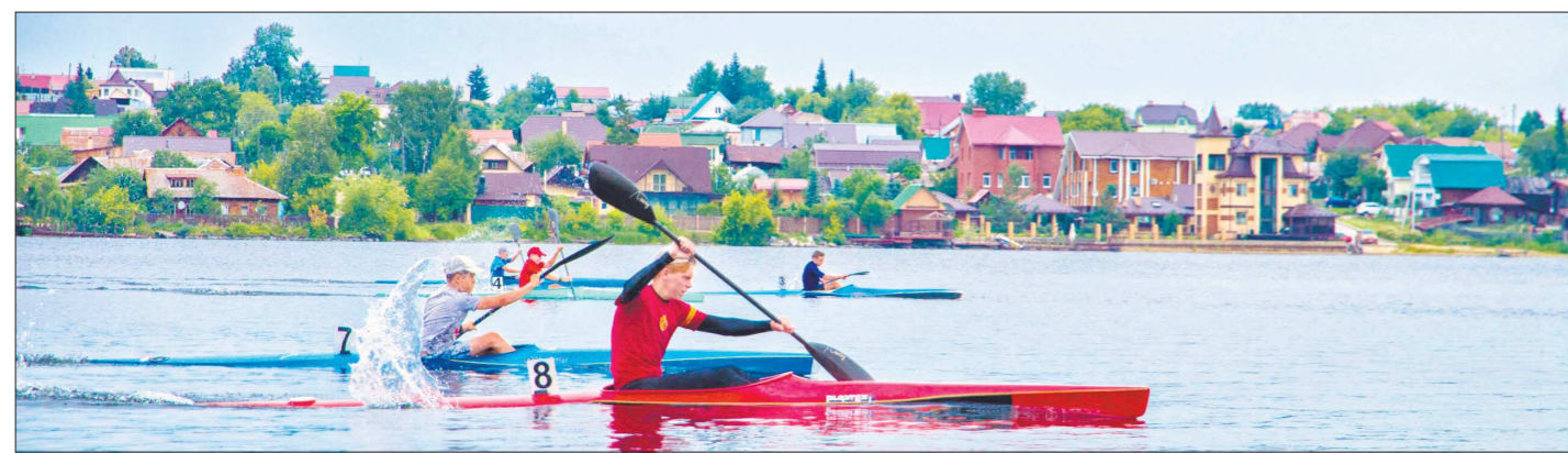
Каменные джунгли столицы Урала гребцы сменили на идиллические пейзажи тихой Сысерти