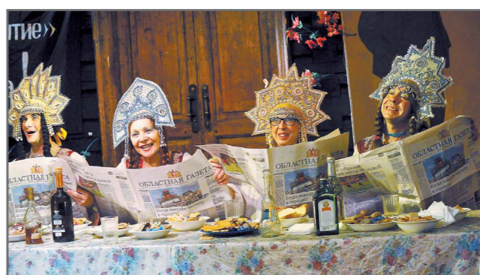
Актёры екатеринбургского «Коляда-театра» читают «Областную газету» даже во время спектаклей (сцена из постановки «Баба Шанель»)