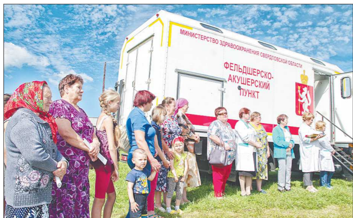
Передвижной ФАП припарковался у сельского клуба. По лестнице, ведущей в фургон, то и дело поднимались и спускались люди – ходили на экскурсию