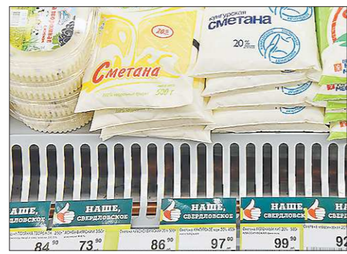
Торговая сеть помогает покупателям сделать выбор и поддержать местного производителя

Торговая сеть «Перекресток» планирует в два раза увеличить своё присутствие в Екатеринбурге. Часть новых супермаркетов будет открыта на площадях, которые ранее занимали магазины сети «Звёздный». Первый из них открылся на прошлой неделе по адресу ул. Лучистая, 2. Супермаркет общей площадью 892 кв. м стал девятым «Перекрестком» в городе.