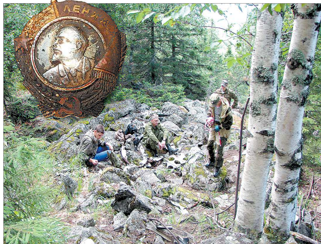
Место, где разбился самолёт — сплошные камни да лес. И только по этому ордену удалось установить, кто летел на самолёте

В мае 2017 года разведке поискового отряда «Держава» повезло обнаружить на камне под мхом орден Ленина. И история с разбившимся самолётом сразу обрела другие очертания. По номеру в отделе награды администрации Президента РФ установили, что он принадлежит легендарному директору Воронежского авиазавода № 18 Матвею Борисовичу Шенкману . Именно здесь первыми наладили производство штурмовиков Ил-2, его ещё называют «летающим танком». Удалось даже найти аварийный акт на это кру-