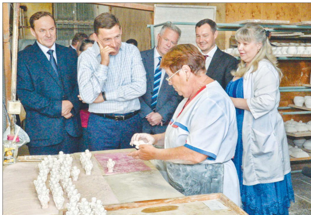
Большую часть продукции работники завода изготавливают своими руками – это гостей особенно поразило

Сысертский фарфоровый завод, который много лет работает в непростых условиях, ждёт модернизация. Руководство предприятия совместно с областным правительством намерено полностью обновить оборудование в цехе, где установлены автономные скоростные печи. Вчера завод посетил врио губернатора Свердловской области Евгений Куйвашев и убедился, что без поддержки инвесторов не обойтись.