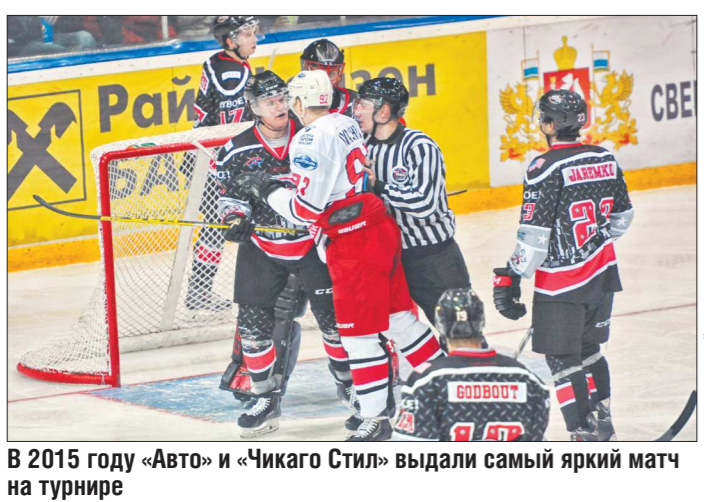
В 2015 году «Авто» и «Чикаго Стилл» выдали самый яркий матч на турнире

– Да! Масштаб обобщения умножается иногда самим временем. А жизнь сегодня, повторяю, развивается «по Вампилову». И не исключено, появится режиссёр, в руках которого «Утиная охота» окажется пьесой не только для чтения, но и для театральной сенсации.