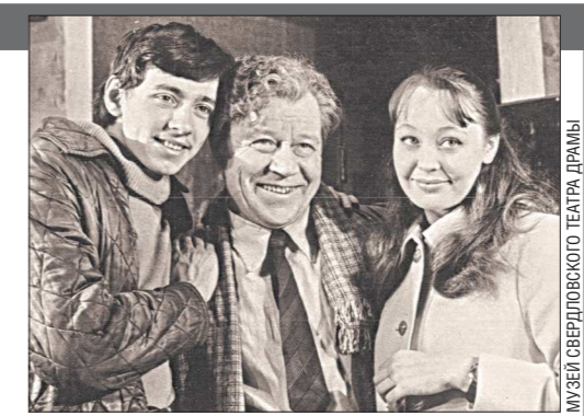
Убеждён: время этих персонажей пройдёт, снова возникнет потребность в таких героях, как Сарафанов, как Валентина из «Прошлым летом в Чулимске». Уже возникла! Не случайно в 2005-м Свердловская драма снова ставила «Старшего сына». Времени было проблемное – хотелось надежды со сцены. А сегодня к героям Вампилова мы то и дело обращаемся со студентами в Театральной школе, где я преподаю.

Общезвестно: что за стенами театра – то востребовано и на сцене. К сожалению, сегодня празднует своё восхождение «мурло». С подачи Николая Коляды слово стало нарицательным, но ещё раньше именно Вампилов стал предвестником тех «героев», что пришли сегодня в жизнь и на сцену. Надолго? Не знаю. Но