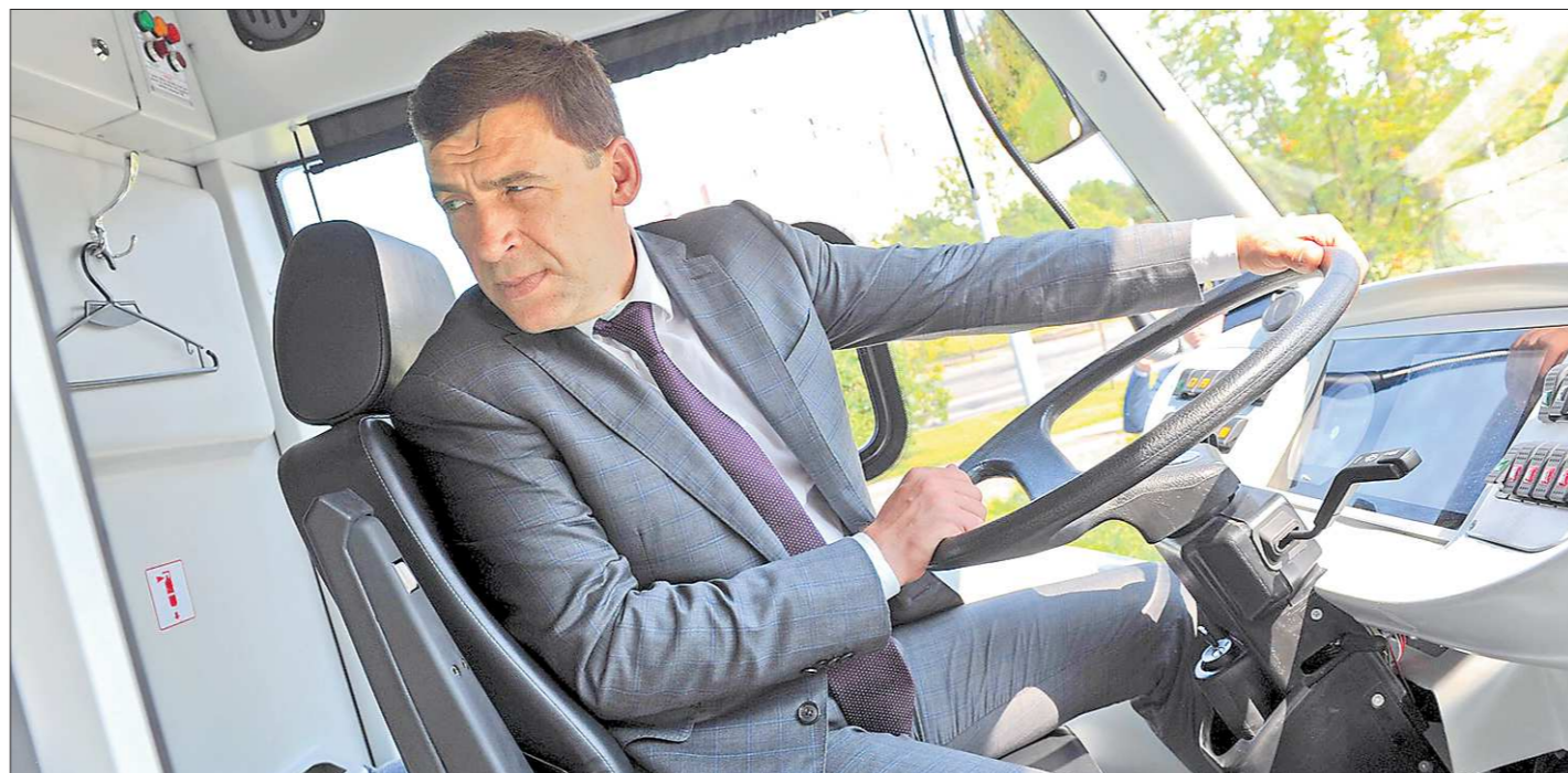
Евгений Куйвашев за рулём белорусского электробуса