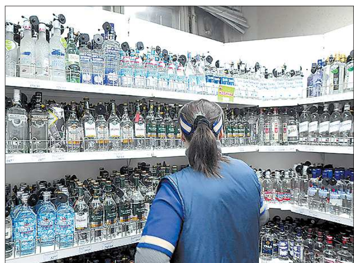
В Свердловской области к системе ЕГАИС уже подключилось 97 процентов городских и сельских магазинов

нот небольшие коттеджи, главное – чтобы в них была скважина. В гараж загоняют «Газель» и за ночь заполняют её палёной водкой, смешивая спирт с водой. Через два-три месяца, когда они примелькались, переходят на другое место и точно так же изготавливают продукцию.