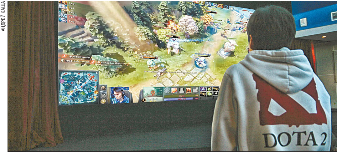
Индустрия киберспорта, построенная на фанатах компьютерных игр, показывает беспрецедентный рост: если в 2015 году выручка в киберспорте была 325 миллионов долларов США, то в 2018 году, по прогнозам, уже должна превысить 1 миллиард долларов

Под главный компьютерный турнир года The International в Сياتле была отведена 17-тысячная Ки-Арена, которая все семь дней чемпионата была забита под завязку. Финал турнира между командой Европы Team Liquid и китайской NewBee в пиковые моменты одновременно смотрели 11 миллионов человек по всему миру (и это новый рекорд, превзойдя достижение 2016 года по интернет-смотру финала в два раза). Ещё один факт, который, правда, напрямую к The International не имеет никакого отношения, но от этого не становится менее примечательным. Весной на мейджоре по Dota 2 в Киеве (турнир уровня Большого шлема в теннисе) 14 тысяч билетов были раскуплены за 20 (!) минут.