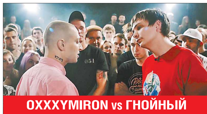
ОХХУМИРОН vs ГНОЙНЫЙ Дискуссии превратились в «драку словами»...