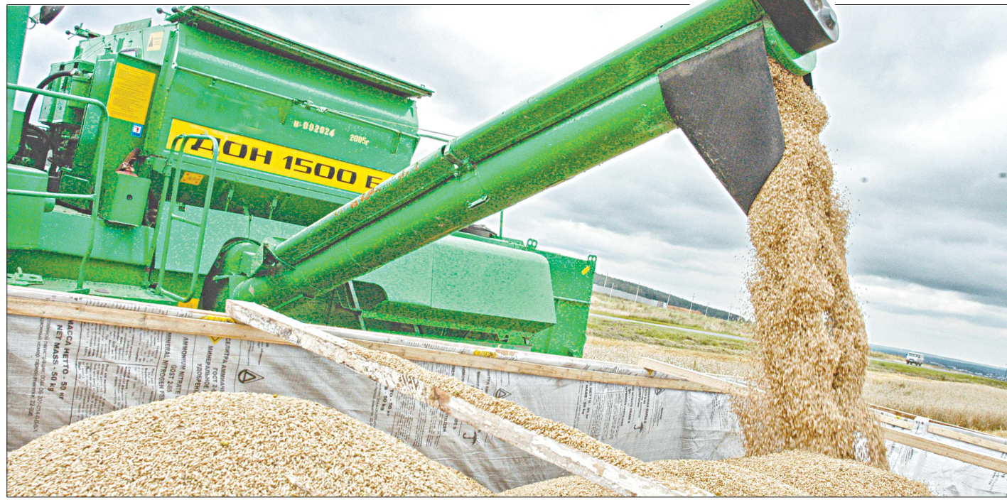
В этом году у аграриев есть возможность получить хороший урожай зерновых

На Среднем Урале стартовала уборка зерновых, и с первых гектаров она приятно удивила аграриев очень высокой урожайностью этих культур – в полтора раза выше прошлогодней на этот же период.