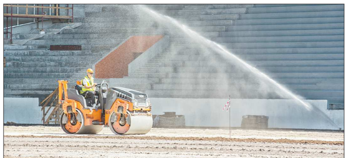
За газоном на главном стадионе города теперь будет следить специальная компания