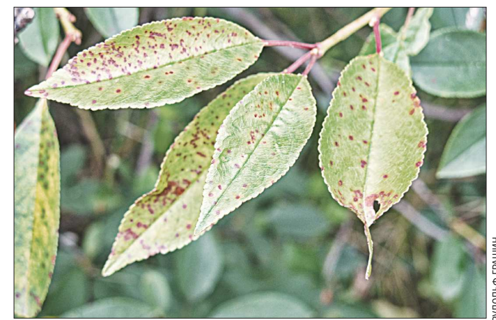
Коккомикоз проявляет себя в виде тёмно-коричневых пятен на листьях