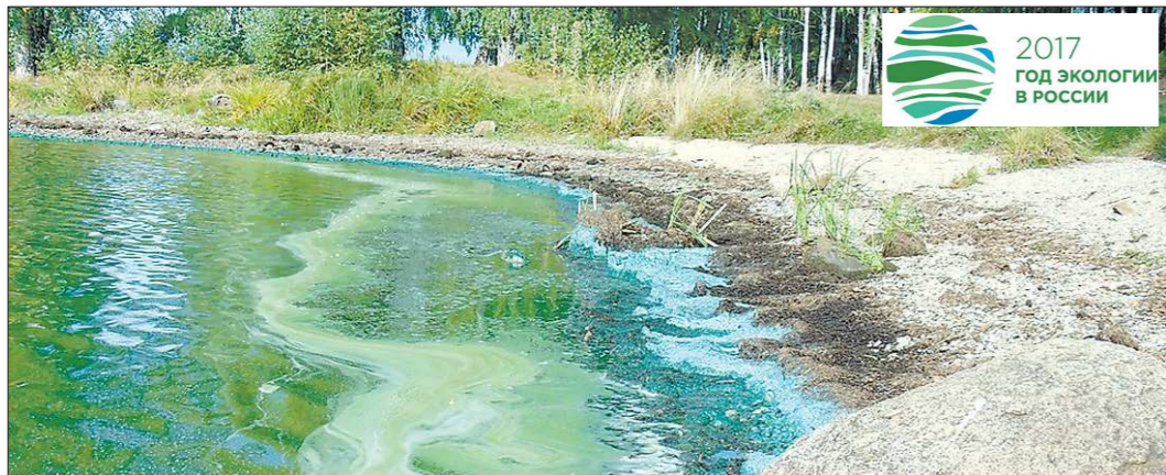
Сине-зелёные водоросли, они же цианобактерии, начинают бурно развиваться при попадании в воду биотоксодов. Водоросли выделяют токсичные вещества, которые убивают других обитателей водоёма