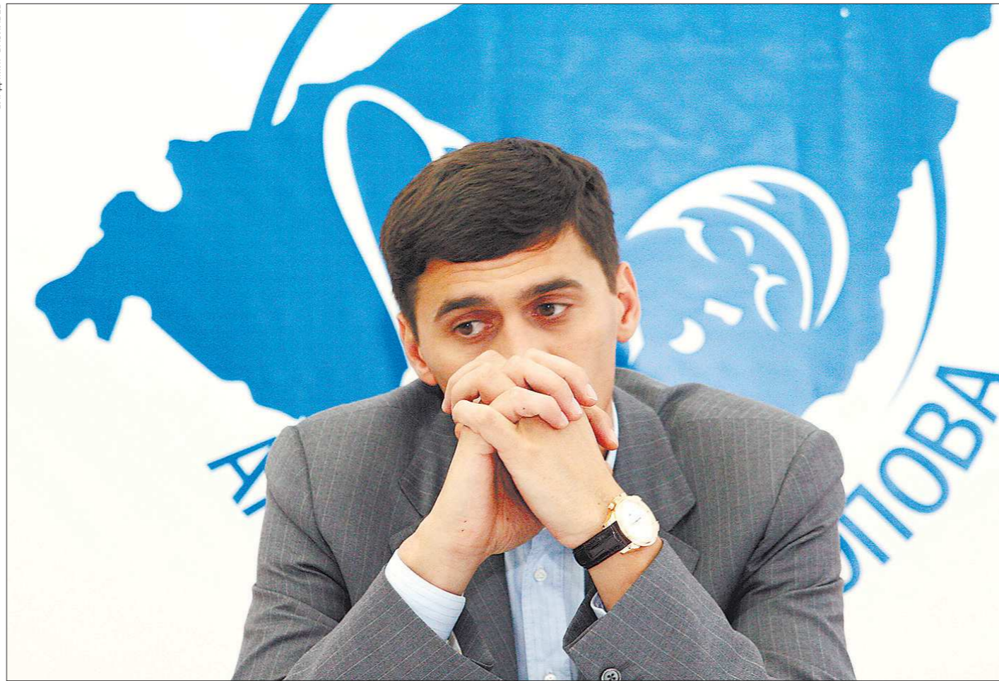
Александр Попов, четырёхкратный олимпийский чемпион и шестикратный чемпион мира по плаванию, уроженец города Лесного

Екатеринбург лишился главного в стране детского турнира по плаванию