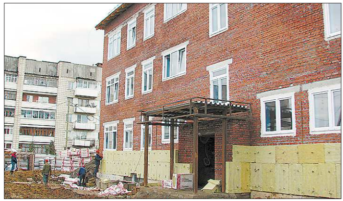
В Верхней Туре предпочли обходиться при переселении своими силами

Облизбирком, как и обещал, опубликовал у себя на официальном сайте списки, кто из муниципальных депутатов, кому из претендентов в губернаторы отдал свой голос.