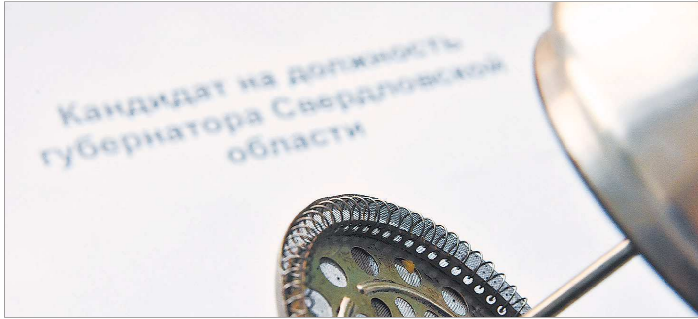
Муниципальный фильтр в регионе не прошли пять кандидатов