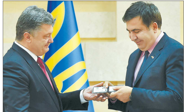
30 мая 2015 года президент Украины Пётр Порошенко назначил Михаила Саакашвили губернатором Одесской области. Но дружба с украинскими властями была недолгой

За несколько дней до начала эпопеи с лишением украинского гражданства Саакашвили объявил о создании им новой партии, целью которой провозгласил свержение «антинародного олигархического режима Петра Порошенко ». Интересно также, что в эти же дни состоялся визит президента Украины в Грузию, где украинскому лидеру пришлось выкручиваться, отвечая на вопрос почему Украина отказывается выдать на историческую родину безлого преступника Саакашвили? Порошенко отвечал, что о запросах грузинской прокуратуры (сообщениями о которых последние два года тоже пестрели новостные ленты СМИ, в том числе и украинские) ему лично ничего не известно. И как бы в подтверждение этих оправданий сразу после возвращения Порошенко в Киев Государственная миграционная служба Украины объявила, что Саакашвили лишается гражданства за то, что при получении украинского па-