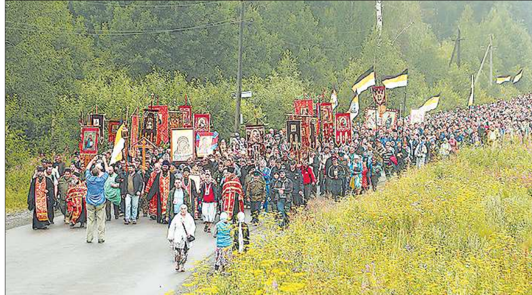
Каждый год во время Царских дней десятки тысяч людей идут крестным ходом от Храма-на-Крови в Екатеринбург до Ганиной Ямы под Среднеуральском. Пешком от начала и до конца. Более 20 километров

— Мода — это внешняя сторона жизни. Она мало связана с содержанием. Если в 90-е годы люди сотнями приходили