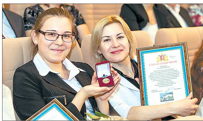
Более 800 юных свердловчан уже получили премии губернатора

Первого августа начнётся первая смена в Уральском образовательном центре «Золотое сечение», который будет работать по методикам сочинского «Сириуса». Новый региональный проект нацелен на поддержку одарённых детей. «ОГ» решила узнать, какую ещё поддержку получают в Свердловской области талантливые дети.