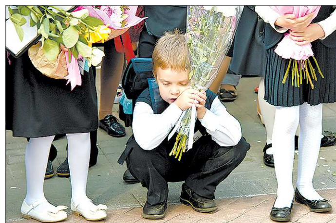
День знаний должен запомниться навсегда...

На базе «Таватюя» проектные смены проводит УрФУ совместно с областным министерством образования. — Участниками первой проектной смены стали 90 ребят. Они разрабатывали новые материалы, которые можно делать с помощью 3D-принтера, а также новые косметические средства на основе раститель-