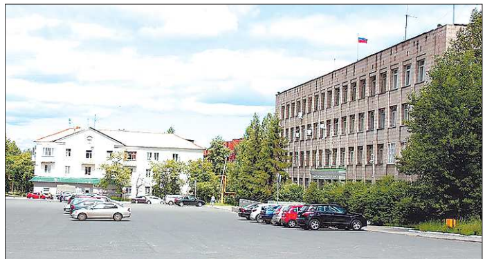
Администрация и дума Нижней Туры находятся в одном здании, но подружиться соседи пока не могут