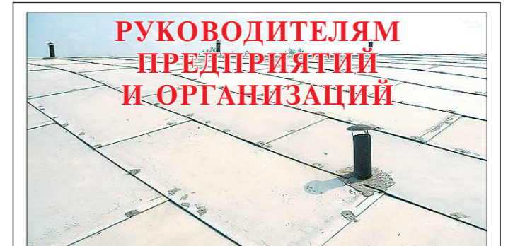
В ваших производственных, административных и жилых зданиях протекает мягкая рубероидная кровля? При ремонте вместо цементной стяжки применяете плоский лист? По нему прокладывают 2-3 слоя рубероида, но пользы нет? Значит, вы применяете старые кровельные технологии. АОР «НП Знамя» разработало и применяет вентилируемую утеплённую кровлю «Урал» с волнистым и плоским листом. В результате потери тепла снизились в 2-3 раза и не стало сосулек, упала стоимость ремонта (нет рубероида), и его можно вести летом и зимой. Применяя технологию «Урал» и нашу продукцию, вы надолго забудете о протечке кровли.

ОБРАЩАЙТЕСЬ! И наши специалисты предоставят вам подробную информацию по разработке.