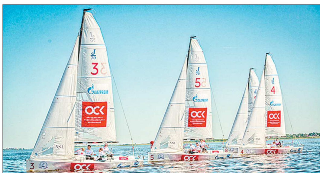
Несмотря на несколько часов проливного дождя, Екатеринбург в целом порадовал участников отличной погодой