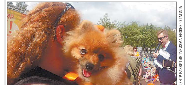
В выходные в Нижнем Тагиле прошёл второй Фестиваль рыжих. Как сообщается на сайте городского центра развития туризма, из 800 участников фестиваля более 300 были с огненным цветом волос. На праздник приехали гости из Екатеринбурга, Верхней Салды, Серова, Ирбита, Омска, Казани, Казахстана и Китая. Некоторые приходили с рыжими питомцами, а одна из участниц даже принесла с собой любимую домашнюю курицу