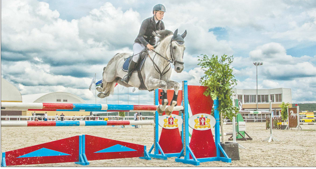
Экипировка в конкуре строго регламентирована. Участники соревнований надевают шлем из лёгкого и прочного пенополистирола, который защищает не только макушку, но и лицо, ридинг-от (спортку для верховой езды), высокие сапоги с маленьким каблучком и штаны без швов между штанинами

Турнир по очень зрелищной дисциплине конного спорта конкура проходит в селе Кадниково уже на протяжении многих лет. Но впервые его поддержало Законодательное собрание Свердловской области.