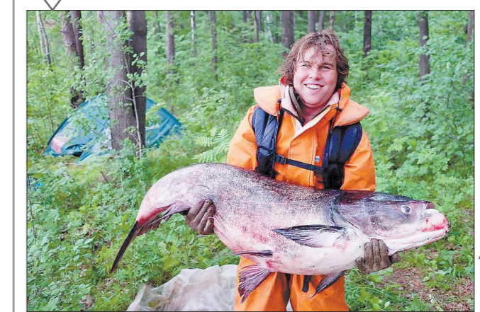
Сотрудники Уральского филиала ФГБНУ «Госрыбцентр» выловили в Исетском водохранилище толстолобика весом 41,88 кг и длиной 125 см. По данным Госрыбцентра, это самая крупная рыба, выловленная в водоёмах Свердловской области.