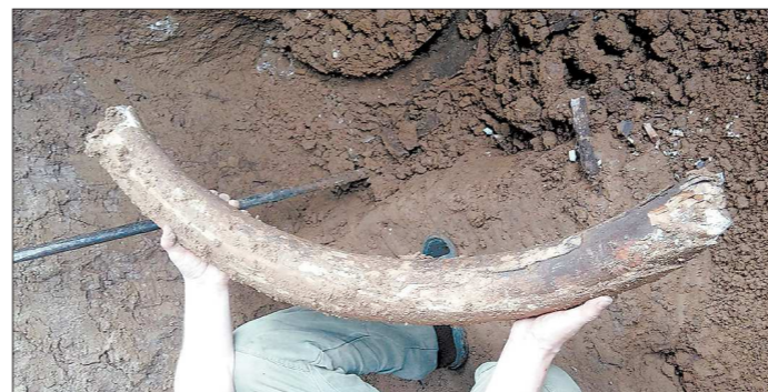
Коуровский бивень и осколки черепа обнаружили на глубине 1,5-2 метра под землёй. Чаще всего на Урале находят кости шерстистого мамонта

В минувшую субботу на месте находки побывал старший научный сотрудник Института экологии растений и животных Уральского отделения РАН Павел Косинцев. — Вероятнее всего, обнаружены части одного скелета мамонта. Чаще всего кости мамонта обнаруживают по берегам рек, куда они переносятся течением из других мест и почвенных слоёв. Здесь находка сделана не