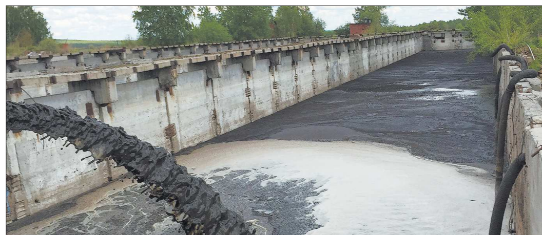
Отходы поступают в иловые карты для отстаивания, но не все они подвергаются обеззараживанию