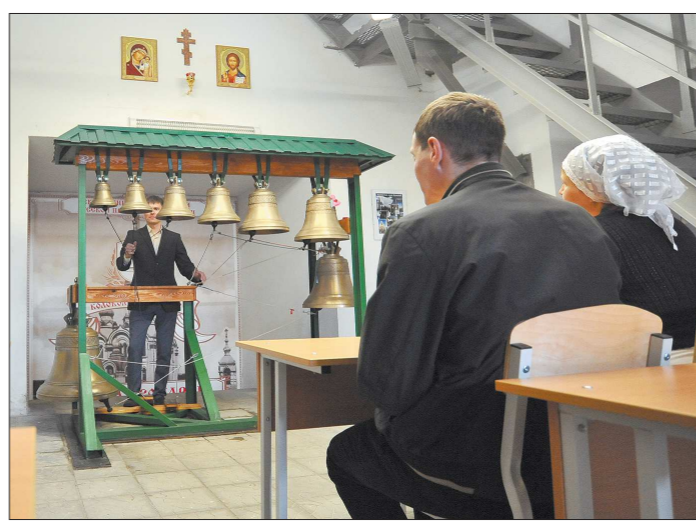
Прежде чем подниматься на звонницу храма, звонари тренируются на учебной колокольне в классе

При этом есть более насущные проблемы, связанные с дорожным движением: расширение дорог, строительство бесплатных паркингов. Надо вести порядок с водителями-иностранными: по словам главы ГИБДД, только 10 процентов из них с первого раза сдают экзамены в России.