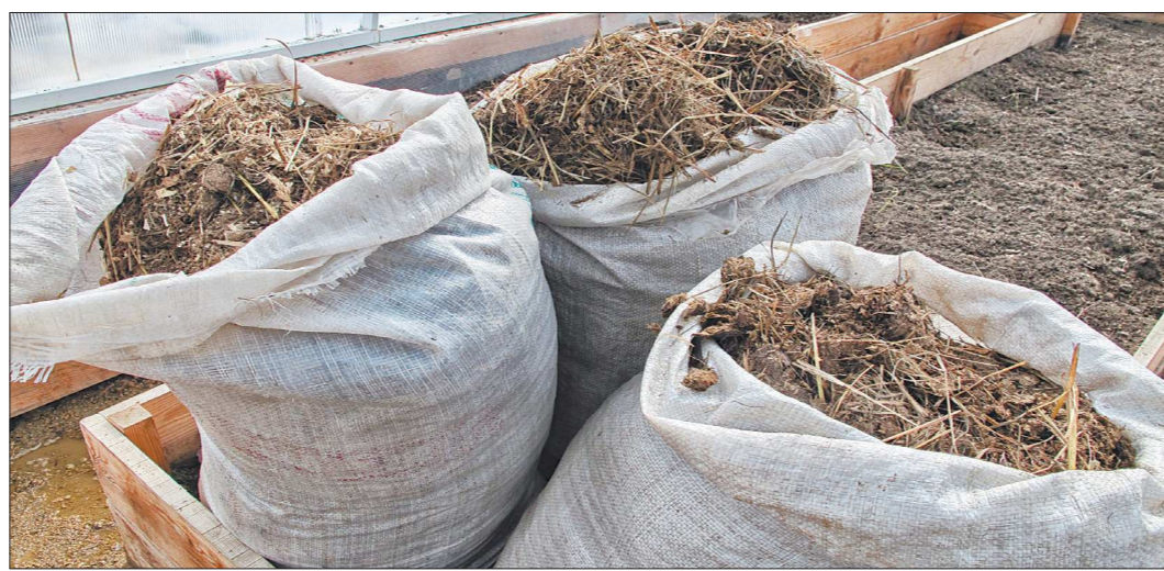
Для дачников навоз – прекрасное удобрение, а для аграриев – постоянная проблема с утилизацией и экологией. Один такой мешок стоит 200 рублей

Минприроды дало разъяснения в специальном письме – навоз и помёт можно реализовывать только в том случае, если