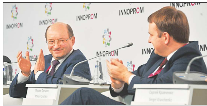
Вице-президент РЖД, экс-губернатор Свердловской области Александр Мишарин заявил, что строительство ВСМ Екатеринбург – Челябинск послужит предпосылкой для формирования уральской агломерации с населением 3,5-4 млн человек