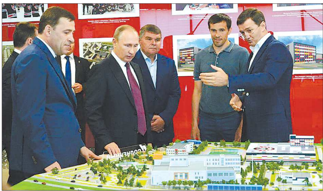
По мнению главы региона, завершение строительства «Арены Авто» выведет развитие детско-юношеского хоккея в Свердловской области на новый уровень

Владимир Путин посетил в Екатеринбурге спортивный комплекс «Дацюк арена», построенный на средства президентского гранта. Также главу государства познакомили с проектом создания ещё одного ледового дворца «Арена Авто».