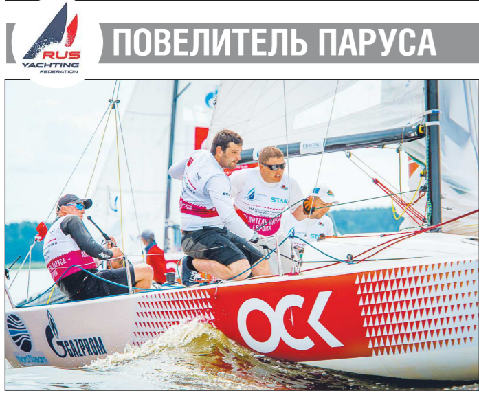
Следующий этап НПЛ пройдёт с 20 по 23 июля в екатеринбургском яхт-клубе «Коматек»