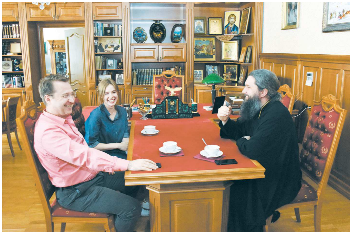
Владыка Евгений: «Священники не прилетели с Марса»

— Безусловно. Я священник, общаюсь с широким кругом людей, в том числе молодёжи. Среди этих людей я не встречал, чтобы после общения человек начал говорить, что недоволен тем, что происходит в Церкви. Ровно то же самое произойдёт, если у человека будет возможность похорошему пообщаться с представителями власти. Откуда взялись чиновник и священник? Они не прилетели с другой планеты, они выросли в той же среде, что и мы с вами. И ожидать, что из той среды, которая сегодня в нашей стране не очень благоприятна для души, выйдет неподобный Сергей Радонежский , не приходится. Я скажу наоборот. Если человек в этой среде вырос и стал священником, то он уже герой. Если он стал руководителем и успешно это делает, он тоже герой. Конечно, и на солнце можно найти пятно. Но, наверное, мы должны заниматься не тем, чтобы искать плохое и из-за этого разрушать сами институты.