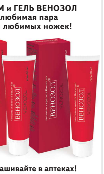
Спрашивайте в аптеках!

ГЕЛЬ ВЕНОЗОЛ используется вечером. Он помогает восстановить Ваши ножки, снимая накопившиеся за день напряжение и усталость. Состав геля также богат ценными натуральными веществами. Гель