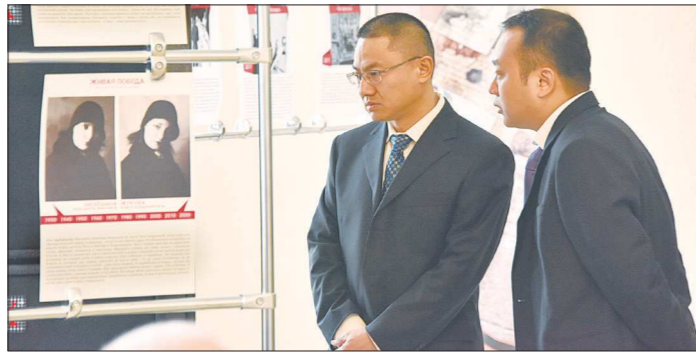
Благодаря участию в нашей акции представителей китайского генконсульства её можно назвать международной

В этот раз мы решили «оживить» подборку «70 стихов о войне» – пригласили друзей нашей газеты, героев наших публикаций, чтобы они прочитали эти строки, хранящие память о буднях и подвигах фронта и тыла.