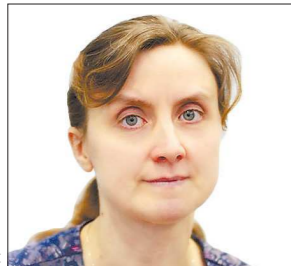
СВЕРДЛОВСКИЙ ОМС №1

Врач Свердловской областной клинической больницы №1 стала победителем Всероссийского конкурса медиков в номинации «Лучший анестезиолог-реаниматолог».