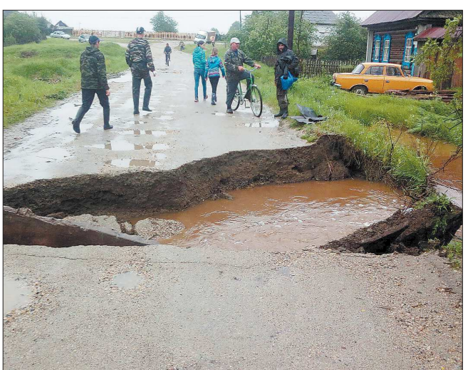
Улицы Махнёво после сильных дождей превратились в венецианские каналы. Вода подтопила несколько десятков частных домов и размыва асфальтовое покрытие (на снимке). Жители с трудом могли попасть в свои подворья, а автомобилисты — проехать по дороге: кое-где проплыть можно только на лодках. Пожарная ситуация — ещё в нескольких муниципалитетах. Так, в Виделе оказались затоплены 37 подворий, несколько человек пришлось эвакуировать