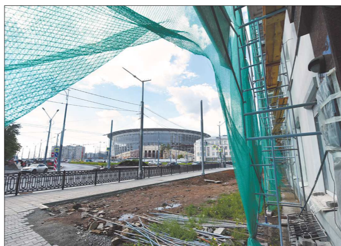
Особое внимание мэрия будет уделять фасадам домов, расположенных неподалёку от стадиона

– Наша задача – сделать так, чтобы каждый архитектурный объект воспринимался целостно. У нас составляется реестр домов, где тезисно по каждому прописано, что необходимо заменить. Например, в жилом доме по Ленина, 2 выбивается из единообразия