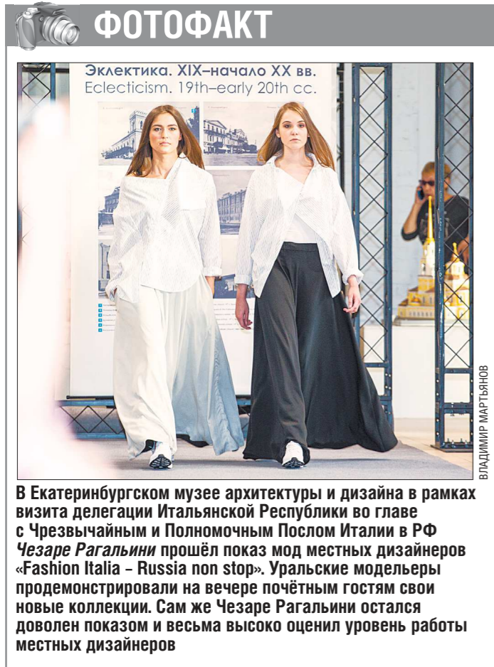
В Екатеринбурге музей архитектуры и дизайна в рамках визита делегации Итальянской Республики во главе с Чрезвычайным и Полномочным Послом Италии в РФ Чезаре Рагальни прошёл показ мод местных дизайнеров «Fashion Italia - Russia non stop». Уральские модельеры продемонстрировали на вечерние почитаемые гостями свои новые коллекции. Сам же Чезаре Рагальни остался доволен показом и весьма высоко оценил уровень работы местных дизайнеров