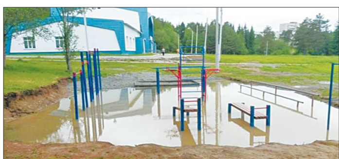
Ситуация в Красноуральске – почти анекдот: «Как ты научился так хорошо подтягиваться?» «Я просто не хотел упасть в грязь лицом»

В Красноуральске дождь затопил спортгородок возле лыжной базы. Комплекс разместился в яме, и теперь запрыгнуть на тренажёры можно только с разбега. Местные жители шутят, что для экономии места силовой городок решили объединить с бассейном. В администрации пообещали площадку поднять и отсыпать щебёнкой.