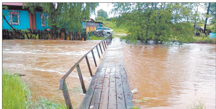
Июньский «паводок» в посёлке Махнёво едва не смыл мост