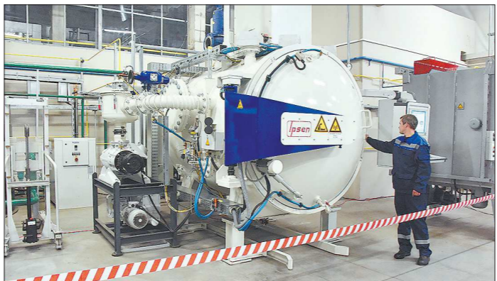
Печь нагревается до 2300 градусов и охлаждается азотом. Процесс обработки мастера отслеживают на специальном экране. Из печи детали сразу отправляются заказчику

Но изменениям рады не только руководители предприятия и областного минпрома, но и простые сотрудники завода, которые занимались термической обработкой деталей. Они отмечают, что условия труда за последнее время заметно изменились в лучшую сторону.