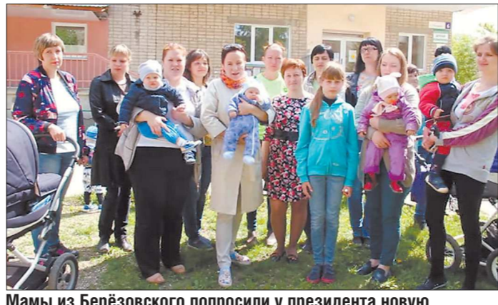
Мамы из Берёзовского попросили у президента новую поликлинику

Среди вопросов, отправленных на «Прямую линию» с Президентом России Владимиром Путиным, были и заданные жителями Среднего Урала. Пусть они не попали в прямую эфир, но их зафиксировали и передали в администрацию президента. Вопросы свердловчан касались возвращения отменённого поезда, газификации частного сектора, уличной торговли, строительства поликлиники, поддержки обманутых дольщиков и инвалидов