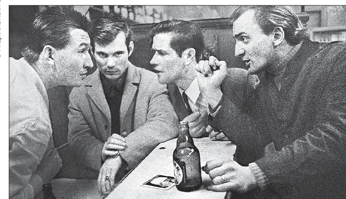
Экспозиция состоит из 63 чёрно-белых снимков. Они были лично отобраны Андерсом Петерсеном

В нынешнем году фестиваль проходит в Екатеринбурге уже в четвертый раз, правда, не без нововведений. Екатеринбургский музей ИЗО, как инициатор и главный организатор мероприятия, решил подключить к культурному проекту несколько новых площадок, значительно увеличив зрительскую аудиторию. В проекте примут участие Музей истории Екатеринбурга, Музей архитектуры и дизайна, Екатеринбургская галерея современного искусства и другие. Цель фестиваля «Фотолето» – это прежде всего популяризация искусства фотографии на Урале и возможность для зрителя познакомиться с работами крупнейших мировых и современных мастеров. В этом году это авторы из России, Скандинавии, Китая и Японии, занимающиеся как документальной, так и концептуальной фотографией. Причём все выставки будут объединены темой города.