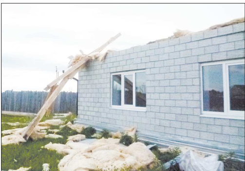
Снаружи дома — как картинка, правда, над одним из них «пороботала» непогода

Муниципалитета, а ныне возглавляет муниципальное предприятие «Теплосистемы». По версии следствия, он сделал это, не убедившись в поступлении в администрацию муниципального образования необходимого пакета документов от застройщика и не проверив соответствие построенных объектов требованиям техрегламентов и проектной документации. В результате «детям-сиротам и детям, оставшимся без попечения родителей, были предоставлены жилые помещения, фактически непригодные для постоянного проживания в них». Сегодня дома стоят осиротевшими. Одни наниматели в предоставленные квартиры даже не заехали. Те, кто