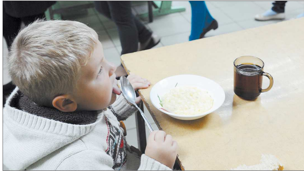
Каша — лучшая еда на завтрак не только для детей, но и для взрослых