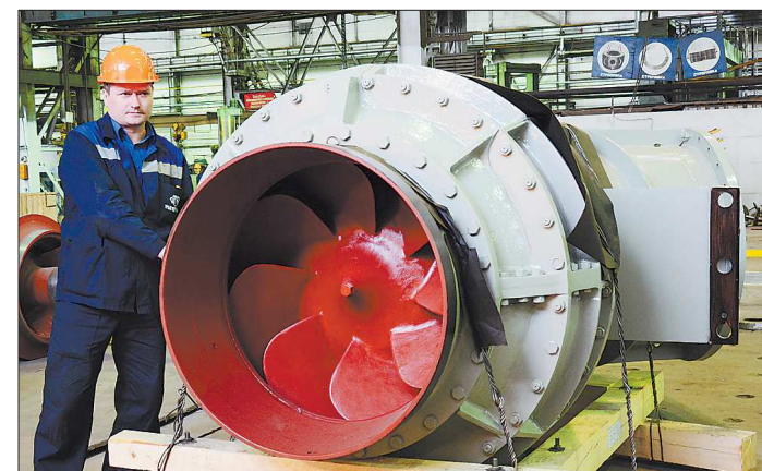
«Уралгидромаш» — производитель насосного оборудования, гидротурбин и электрических машин. На предприятии трудятся более тысячи человек

УФНС России по Свердловской области предъявила «Уралгидромашу» (градообразующее предприятие Сысерти) иск о банкротстве. Согласно информации, размещённой на сайте Арбитражного суда региона, предприятие задолжало налоговикам более 452,1 миллиона рублей. На предприятии заявили, что ещё не видели иска и от комментариев отказались. К слову, в 2015 году в отношении «Уралгидромаша» уже был иск о банкротстве. Тогда заявление в Арбитражный суд региона подавал ООО «Ступинский торговый дом» из-за долга в 3,9 миллиона рублей. Судебное производство было прекращено спустя полгода в связи с погашением задолженности. Александр ПОНОМАРЁВ