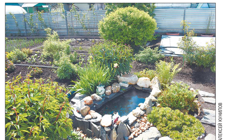
Посмотрите, как украсило сад вроде бы нехитрое сооружение!