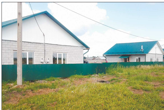
Снаружи дома — как картинка, правда, над одним из них «пороботала» непогода

На днях посёлок Махнёво Алапаевского района стал героем практически всех региональных СМИ: в Алапаевские следственные органы возбудили уголовное дело по факту халатности при приёмке и вводе в эксплуатацию жилых домов для детей-сирот. Проблема получила огласку... после урагана, который сорвал крышу с одного из домов. Оказалось, что эти дома фактически брошены на произвол администрации ими мало интересуется, а большинство хозяев просто не живут в предоставленных квартирах.