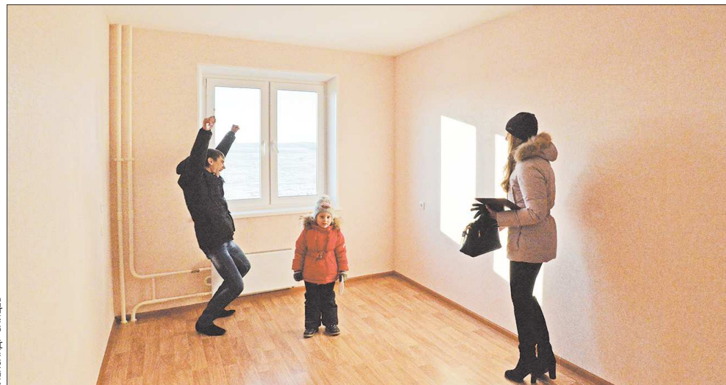
Жильё для врачей

По словам Евгения Куйвашева, нередко складывается парадоксальная ситуация, когда бюджетные деньги и средства инвесторов затрачены, инфраструктура построена, но объекты газоснабжения просто не вводятся в эксплуатацию. Одна из главных причин этого в том, что у потребителей, особенно у многодетных семей, пенсионеров и малоимущих граждан, нет возможности подключиться к сетям. Государственная поддержка при газификации жилых домов в Свердловской области сегодня оказывается только малоимущим семьям и малоимущим одиноко проживающим гражданам. Её размер варьируется в пределах 35 тысяч рублей. Что касается неработающих пенсионеров, то с 1 января 2015 года оказание помощи им было прекращено. В разработке свердловского Закона об энергетике уже имеется законопроект, который включает эту категорию граждан в перечень, — объявил на конференции «ЕР» Евгений Куйвашев.