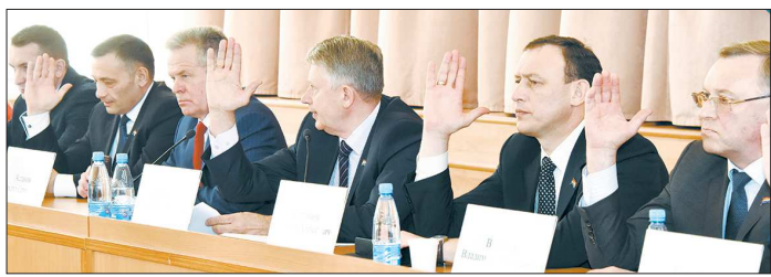
«Единая Россия» разрешила своим однопартийцам в местных думах поддержать альтернативных кандидатов в губернаторы