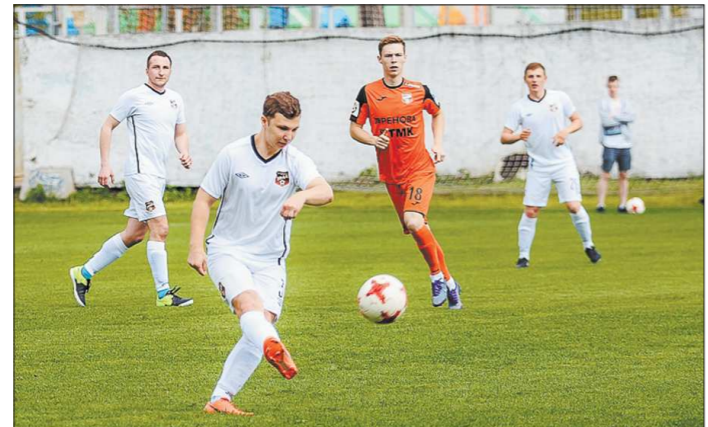
Журналист «ОГ» вышел на поле с первых минут матча и играл на позиции правого полузащитника

С первых минут матча стало ясно, что соперничать с «Уралом» на равных болельщикам просто нереально. Это когда ты сидишь на трибуне или дома перед телевизором, кажется, что футболисты играют ничуть не лучше парней со двора, но когда в течение пяти минут болельщики просто не могли отобрать у «шмелей» мяч, ста-