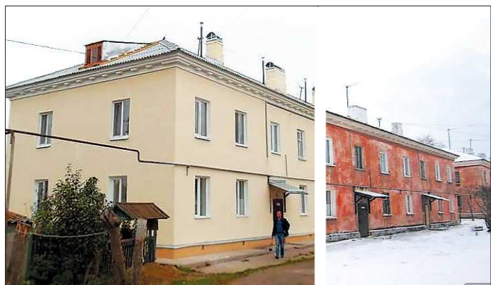
Сухой Лог, которым Станислав Суханов руководил больше восьми лет, в числе первых приступил к реализации программы. Вот вид одного из домов после и до ремонта