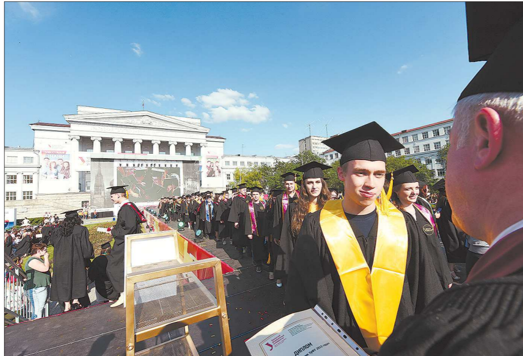
Эти молодые люди, видимо, не знают, что абсолютное большинство вакансий на рынке труда в регионе не требуют высшего образования. Сегодня востребованы выпускники колледжей и техникумов

— Ерунда! Не то, что в советское время, когда кон-