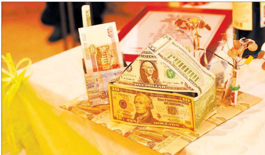
В 2018 году ставки по ипотеке могут опуститься до 9 процентов

Тенденцию подтверждают и банкиры. По данным пресс-службы Уральского банка Сбербанка, количество выданных кредитов за пять месяцев 2017 года увеличилось на 7,1 процента по сравнению с аналогичным периодом 2016 года. А общая сумма выданных жилищных кредитов возросла на 12 процентов, с 9 до 10,1 млрд рублей. Средний размер выданного жилищного кредита по сравнению с прошлым годом вырос на 4,8% (1,56 млн рублей в 2017 году против 1,48 млн рублей в 2016 году).