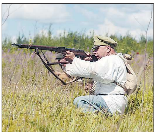
Военно-исторический фестиваль-реконструкция «Покровский рубеж» поддерживается правительством Свердловской области и входит в календарь основных туристических событий региона

Интереснее получилось с ещё одним батутом: полицейские просто не нашли его по заявленному адресу. Заграницей тут нет — некоторые предприниматели держат по несколько таких аттракционов в разных концах города. И узнав от сотрудника с одной точки о том, что его только что проверили, они спешат свернуть остальные «дуги» предприятия. Была случай, когда огромные каучуковые конструкции сдувались за считанные секунды и отпавшими в «Газель» прямо на глазах подъезжающих полицейских.