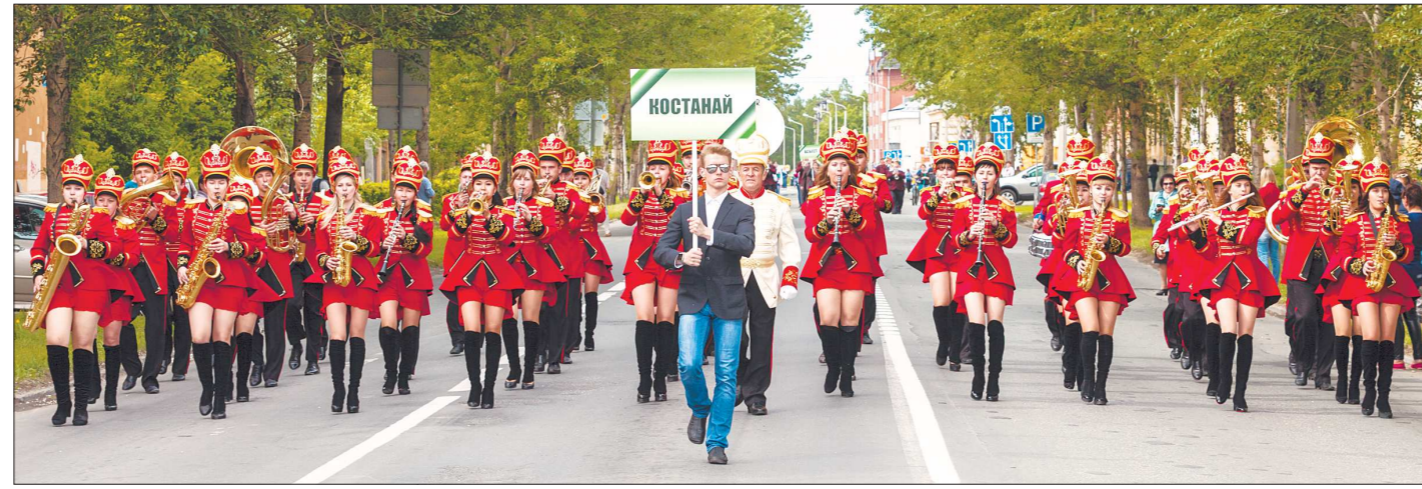
Иностранцы в Новоуральске! Духовой оркестр из Казахстана шествует по улице Первомайской по площадке перед культурно-спортивным комплексом, где ему вручат главный приз фестиваля – Кубок Росатом