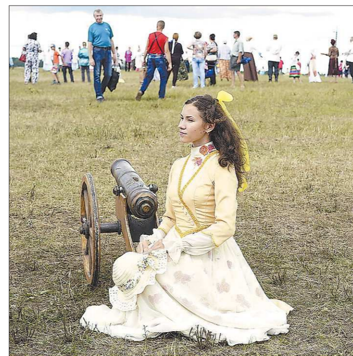
Гости фестиваля проходили квесты, знакомились с оружием и бытом начала XX века, фотографировались в костюмах той эпохи

Как отметил первый заместитель руководителя администрации губернатора Свер-