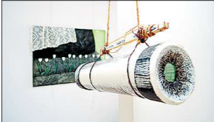
Адрес: Екатеринбург, ул. Красноармейская, 32. Выставка работает до 12 июня.