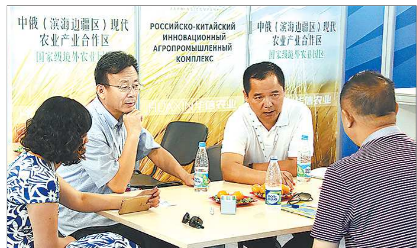
В этом году ожидается заключение минимум трёх контрактов, связанных с поставкой сельхозтоваров из Свердловской области в Китай

● ТРАНСПОРТ. В пятницу в Санкт-Петербург прилетел глава региона Евгений Куйвашев. Одно из первых подписанных им соглашений — о начале строительства скоростной магистрали Екатеринбург — Челябинск, которая соединит три ключевые станции — Екатеринбург, Касли и Челябинск — стало наиболее значимым итогом форума для свердловчан. Подписи в документе, определяющем