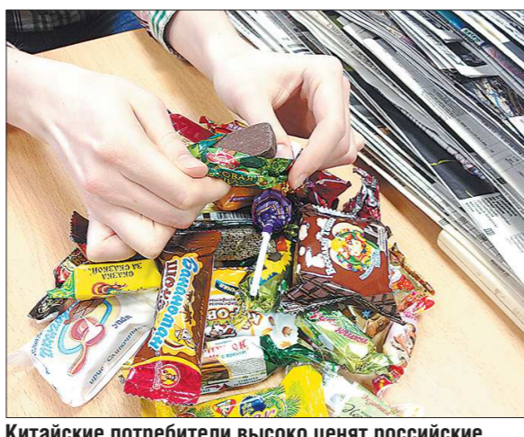
Китайские потребители высоко ценят российские кондитерские изделия. Спрос на них пока превышает предложение