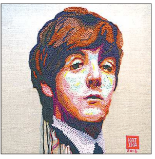
Адрес: Екатеринбург, ул. Красноармейская, 32. Выставка продлится до 12 июня.

Эта персональная выставка уральского автора Катерины Пекзиной , открытая в Екатеринбургской галерее современного искусства. Впервые живописец и дизайнер демонстрирует публике особую технику на стыке декоративно-прикладного искусства и графики. Материал и техника исполнения — от рукоделия, а точнее, вязания, а сюжеты и стиль — скорее от графики. Тематика представленных работ варьируется от интерпретации современных явлений и трендов до портретов знаменитостей. Последние особенно удаются художнице, на выставке можно встретить изображения Сальмы Хайек, Джона Финна, Милан Фармер, Даниэля Хармса и Пола Маккартни .