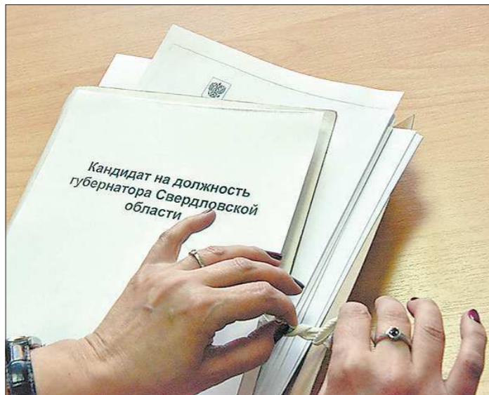
Подписи в поддержку кандидатов в избирательную комиссию должны быть поданы с 16 по 26 июля

Нотариусы Свердловской области установили тариф за заверение подписи в поддержку кандидата в губернаторы на грядущих выборах. В среднем заверить подпись муниципального депутата можно будет за 1083 рубля, однако в зависимости от территории назначенная сумма может незначительно меняться. Подписи глав муниципалитетов, избранных на всенародных выборах, будут заверять бесплатно в качестве исключения — таких мэров, в связи с переходом на «пютую модель» выборов главы, осталось совсем немного.