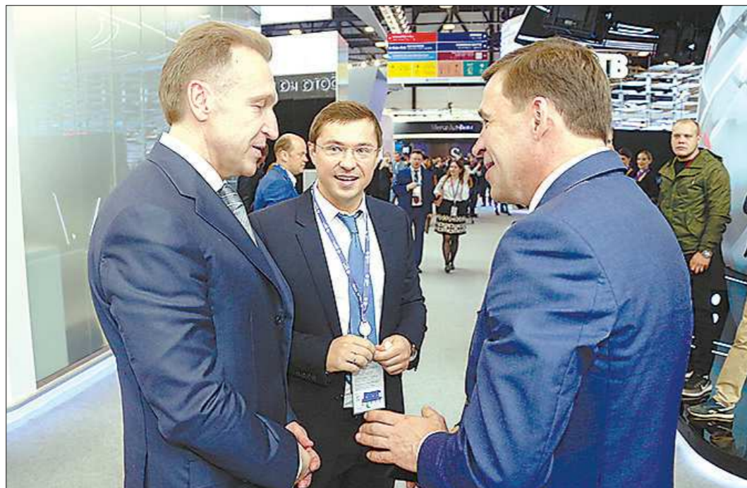
В кулуарах форума Евгений Куйвашев успел пообщаться с вице-премьером российского правительства Игорем Шуваловым (слева)

Сегодня, 3 июня, в Санкт-Петербурге завершается Петербургский международный экономический форум, где работает делегация Свердловской области, которую возглавляет врио губернатора Евгений Куйвашев. За два дня пребывания на форуме первые лица области провели переговоры о реализации важных инвестпроектов, а также подписали несколько соглашений.