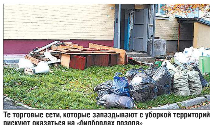
Те торговые сети, которые запаздывают с уборкой территорий, рискуют оказаться на «билбордах позора»